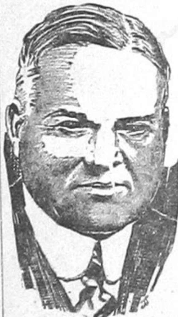
Hoover, um dos propagandistas da guerra á U. R. S.

Soviets, este ultimo tratou ainda de outros assumptos de grande importancia, entre elles o da situação politica exterior da União Sovietica.