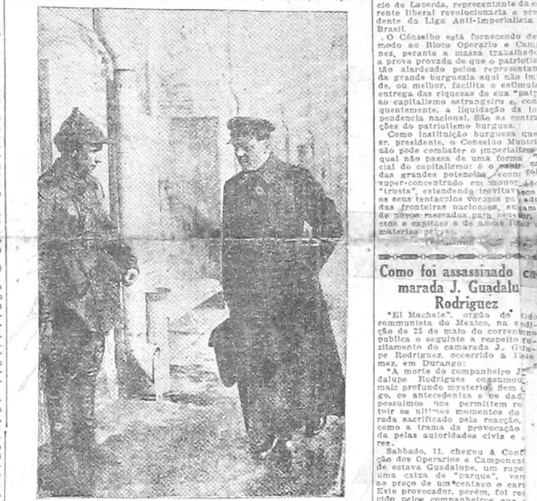
O camarada Vorochilov, commissario do povo para a Defesa Nacional, cargo que equivale ao de ministro da Guerra. Ao seu lado, vê-se um soldado do Exercito Vermelho