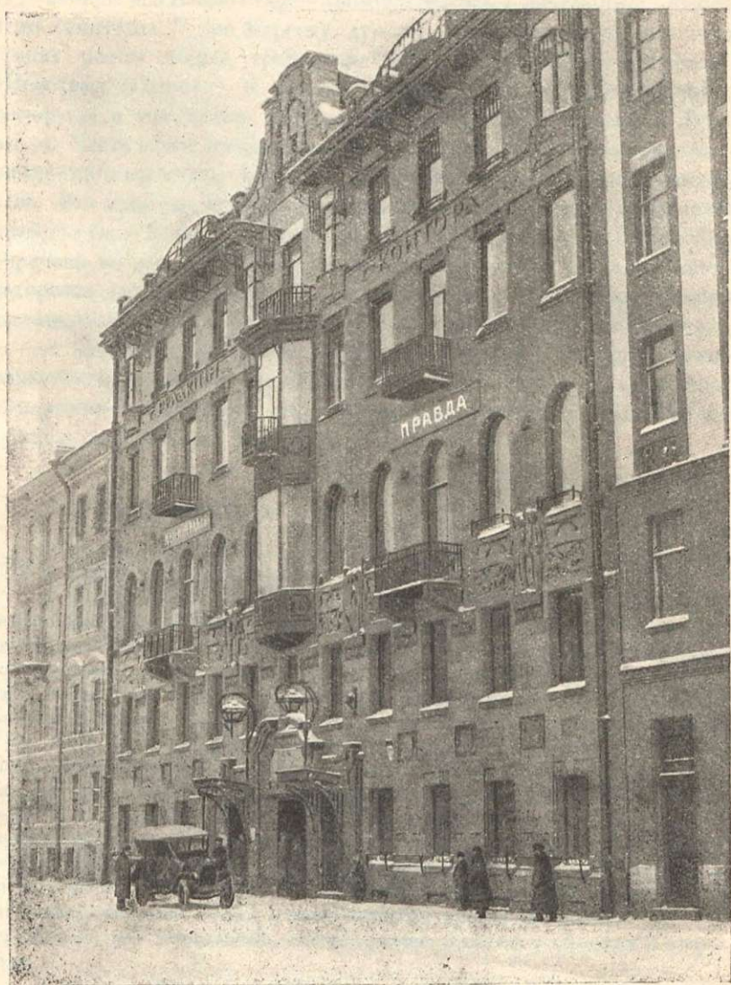
Типография на Сотдиалистической (б. Ивановской) ул., д. 14, в Ленинграде. где печатались «Звезда» и «Правда» в 1910 — 1914 г.г.