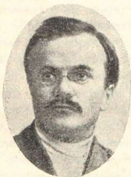
В. М. Молотов.