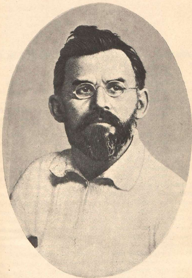
Г. И. ПЕТРОВСКИЙ