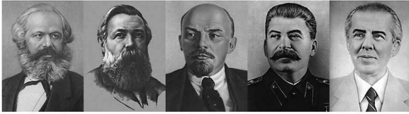
Karl Marx, Friedrich Engels, Vladimir Lenin, Joseph Stalin, Enver Hoxha