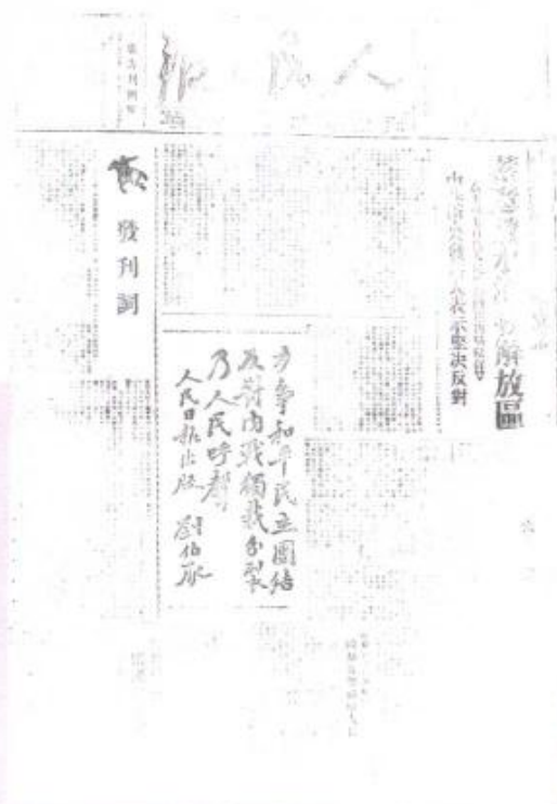
人民日报于1946年5月15日在邯郸创刊。