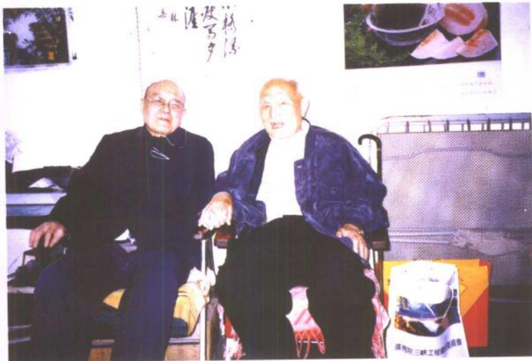
作者 1997 年同温光中同志在天津合影。