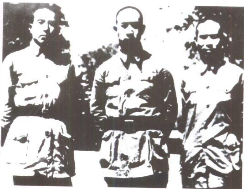
太岳区党政军领导人安子文(左)、薄一波(中)、牛佩踪(右)在一起。