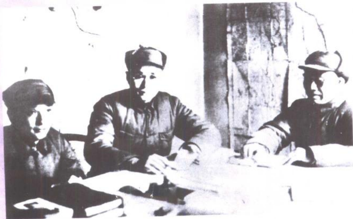
朱德总司令同刘伯承师长、邓小平政委研究作战部署。