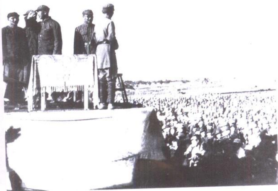
刘伯承、邓小平、薄一波在邯郸检阅南下部队。