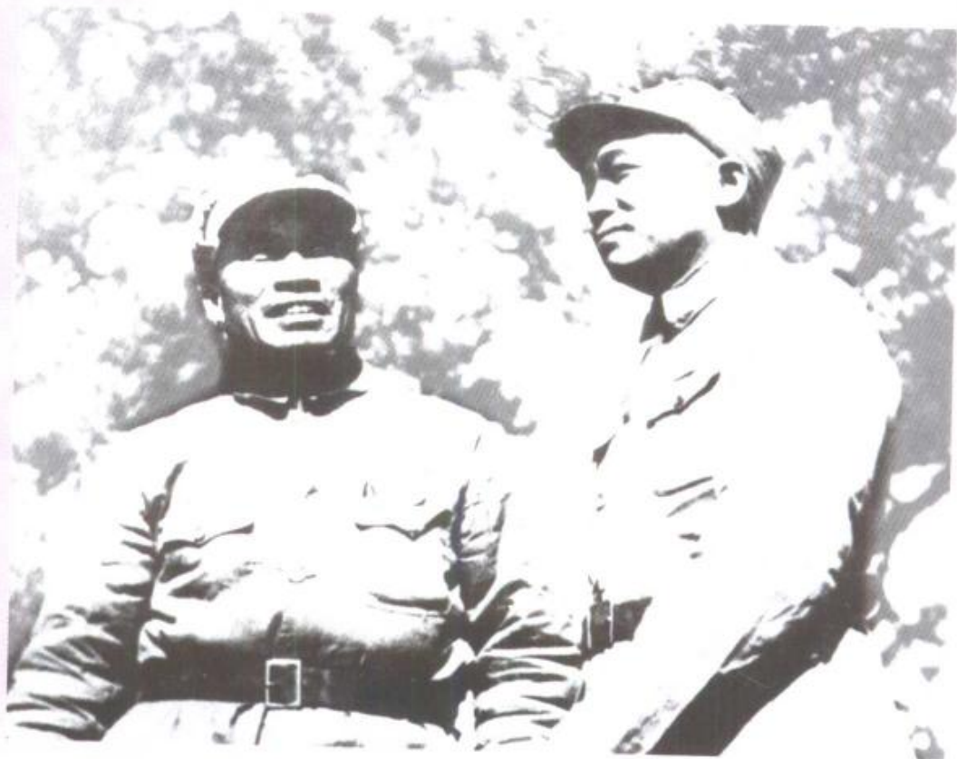
朱德总司令、彭德怀副总司令来到晋东南抗战前线。