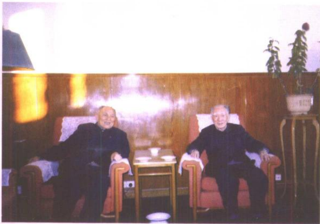
作者看望薄一波同志。