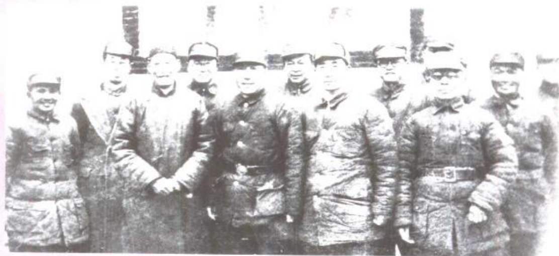
刘伯承（后排左二）、邓小平（前排左一）、薄一波（前排右二）、杨秀峰（后排左一）欢迎高树勋（前排左三）将军起义合影。