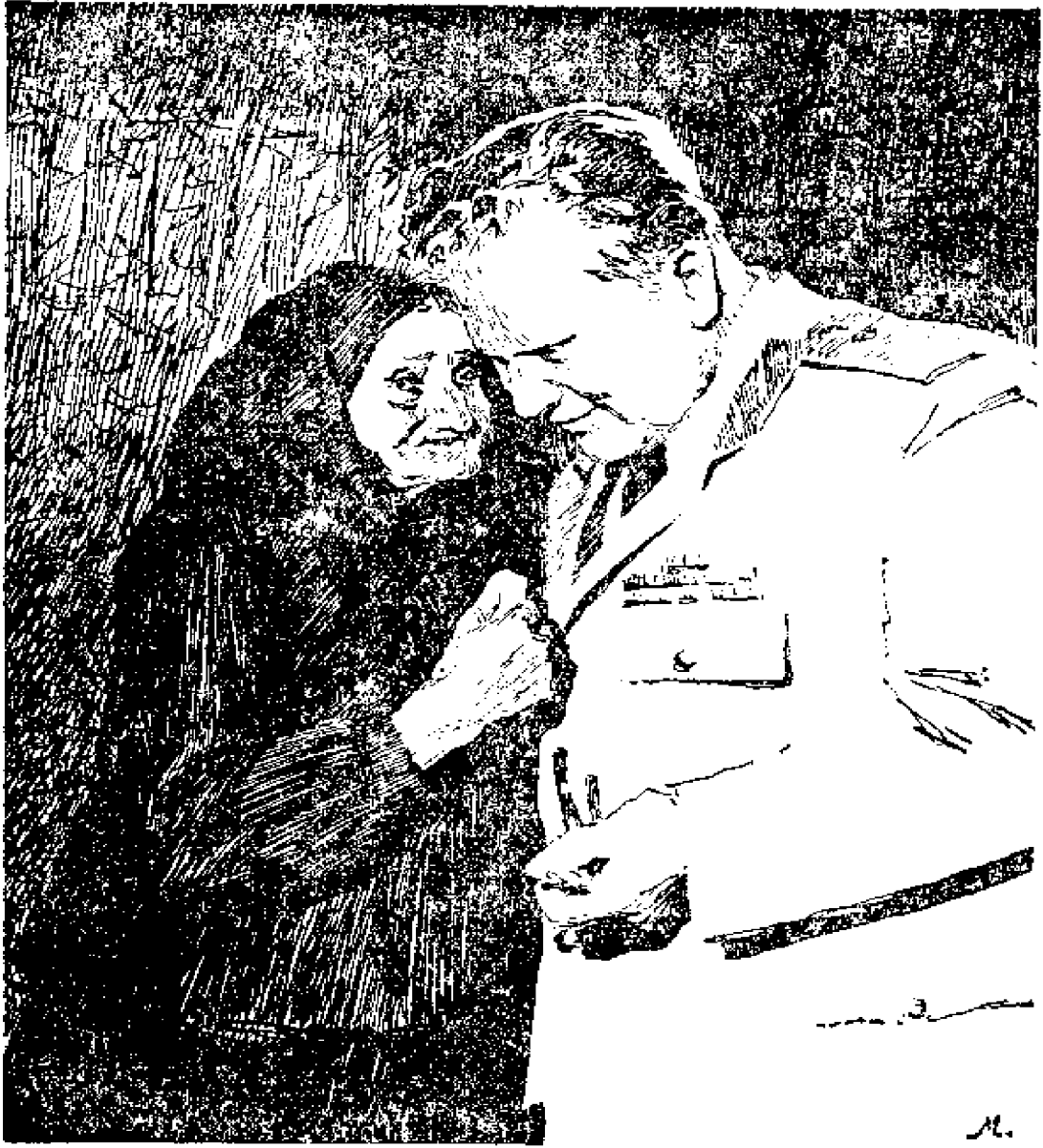
1953年5月 铁托和老农妇，在斯拉沃尼亚布罗德