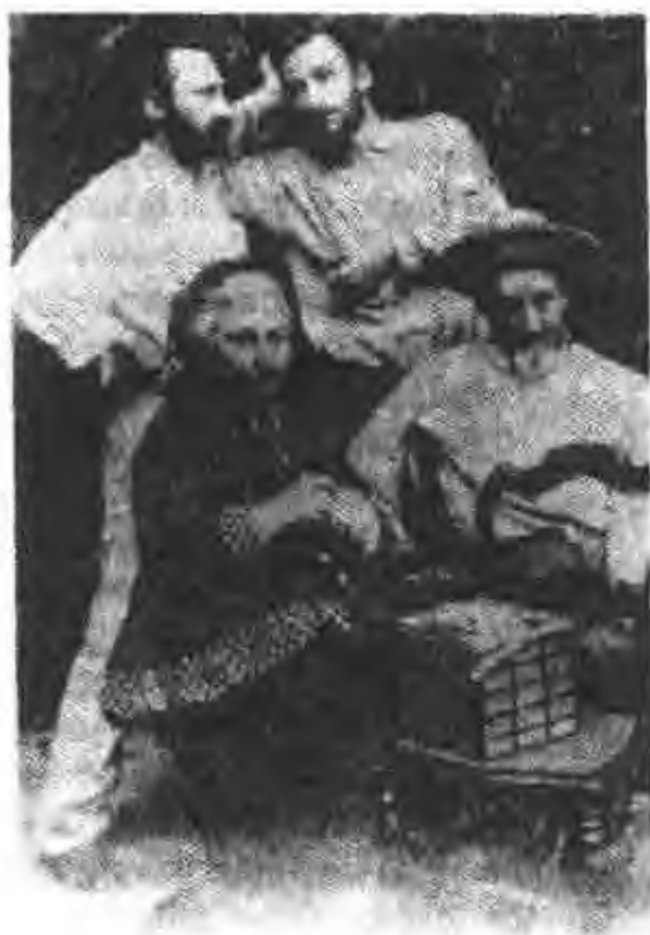
图2 皮埃尔·居里的家庭成员(1878)。欧仁·居里医生，他的妻子和他的儿子：左上，雅克；右边，皮埃尔