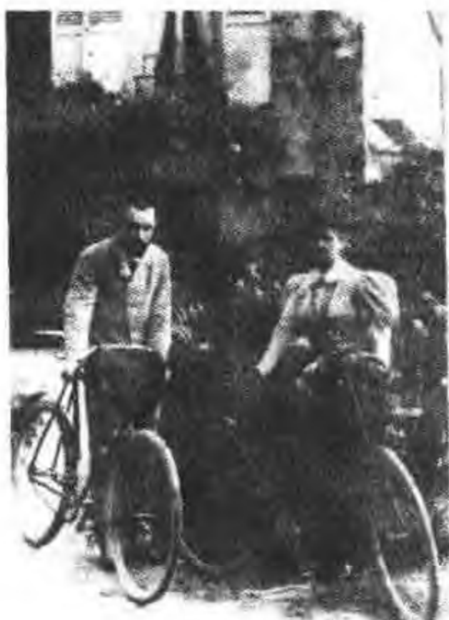
图 12 居里夫妇在西奥镇家中的花园(1895)