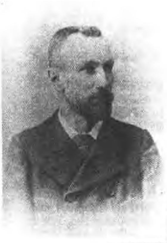
图6 35岁时的皮埃尔·居里(1894)