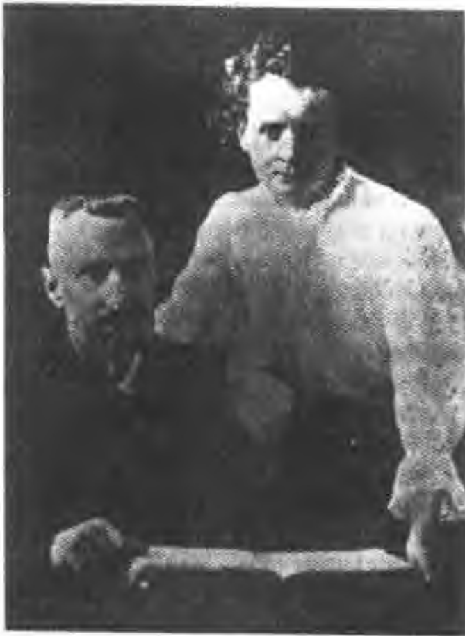
图 20 居里 夫妇(1904)