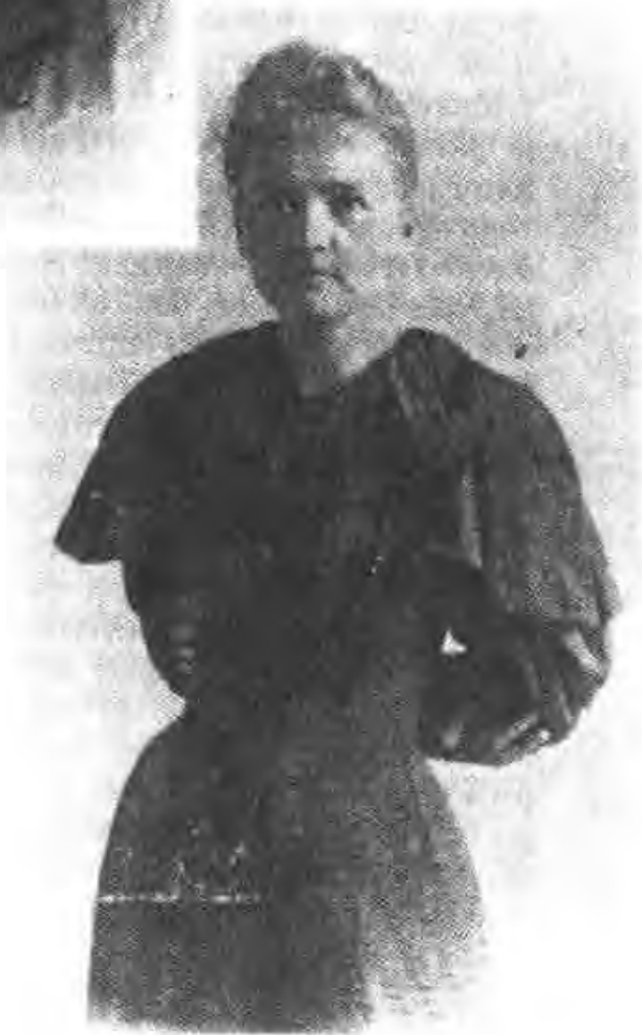
图7 大学时代的玛丽·斯克罗多夫斯卡，在巴黎(1894)