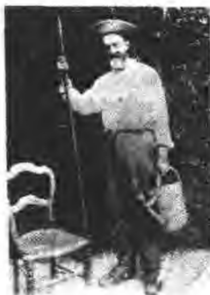
图 5 居里医生,皮埃尔·居里的父亲