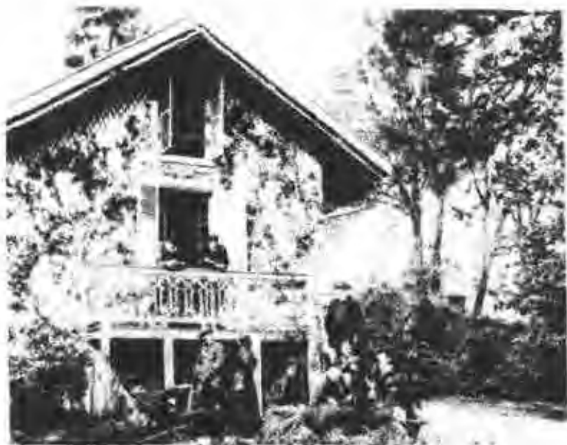
图 3 欧仁医生家 在西奥镇的 星期天 聚会