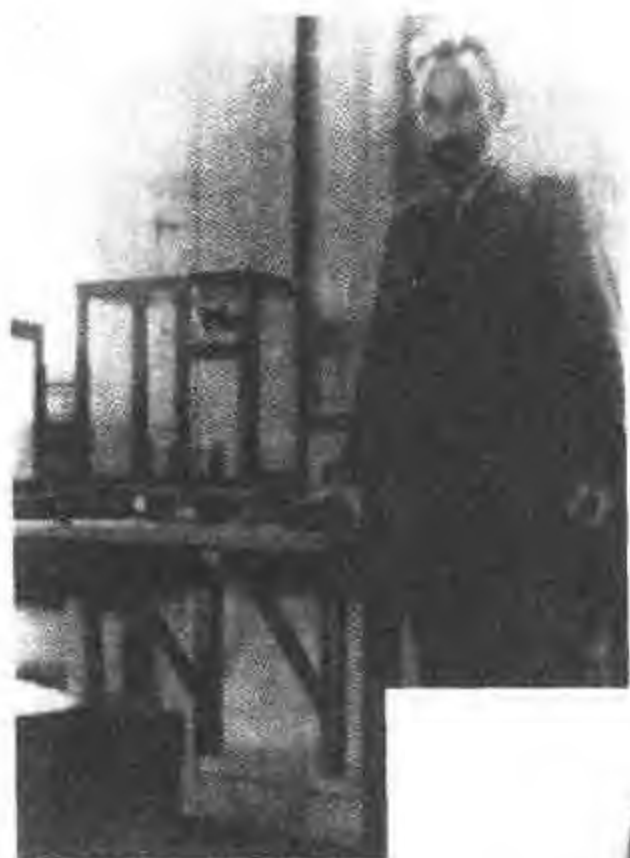
图 25 皮埃尔 ·居里在他的实 验室(1906)