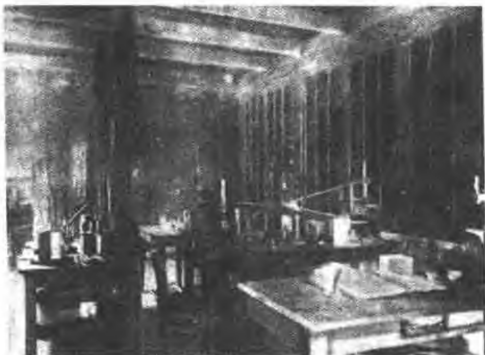
图 16 测量仪器：静电计、压电石英和电离室