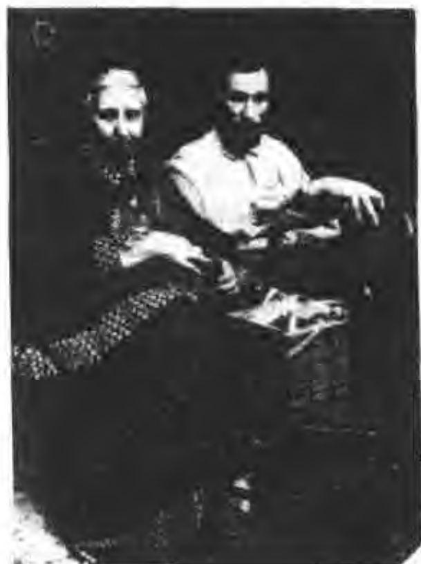
图 4 皮埃尔·居里和他的母亲