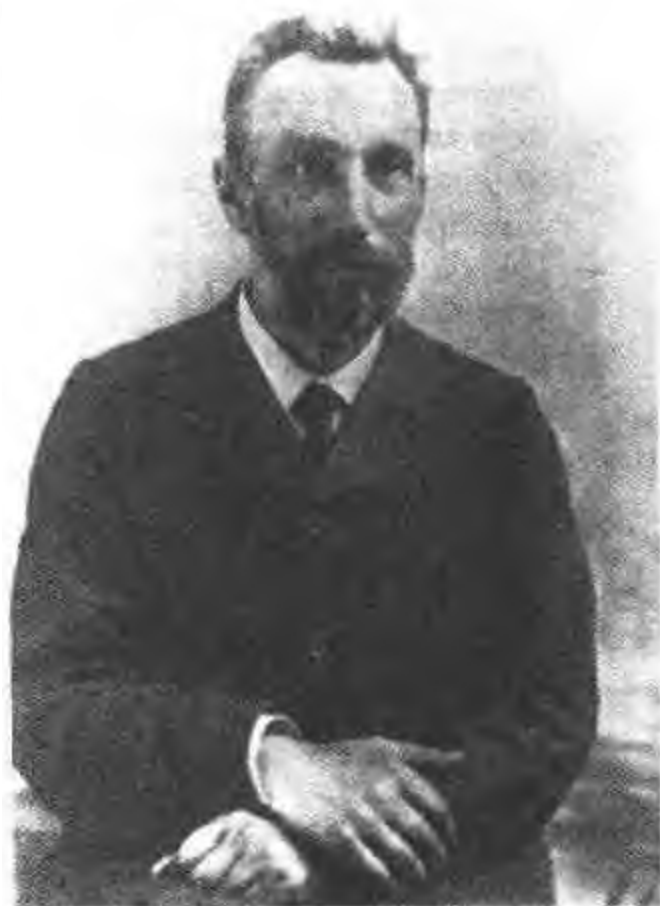
图 26 皮埃尔 ·居里(1905)