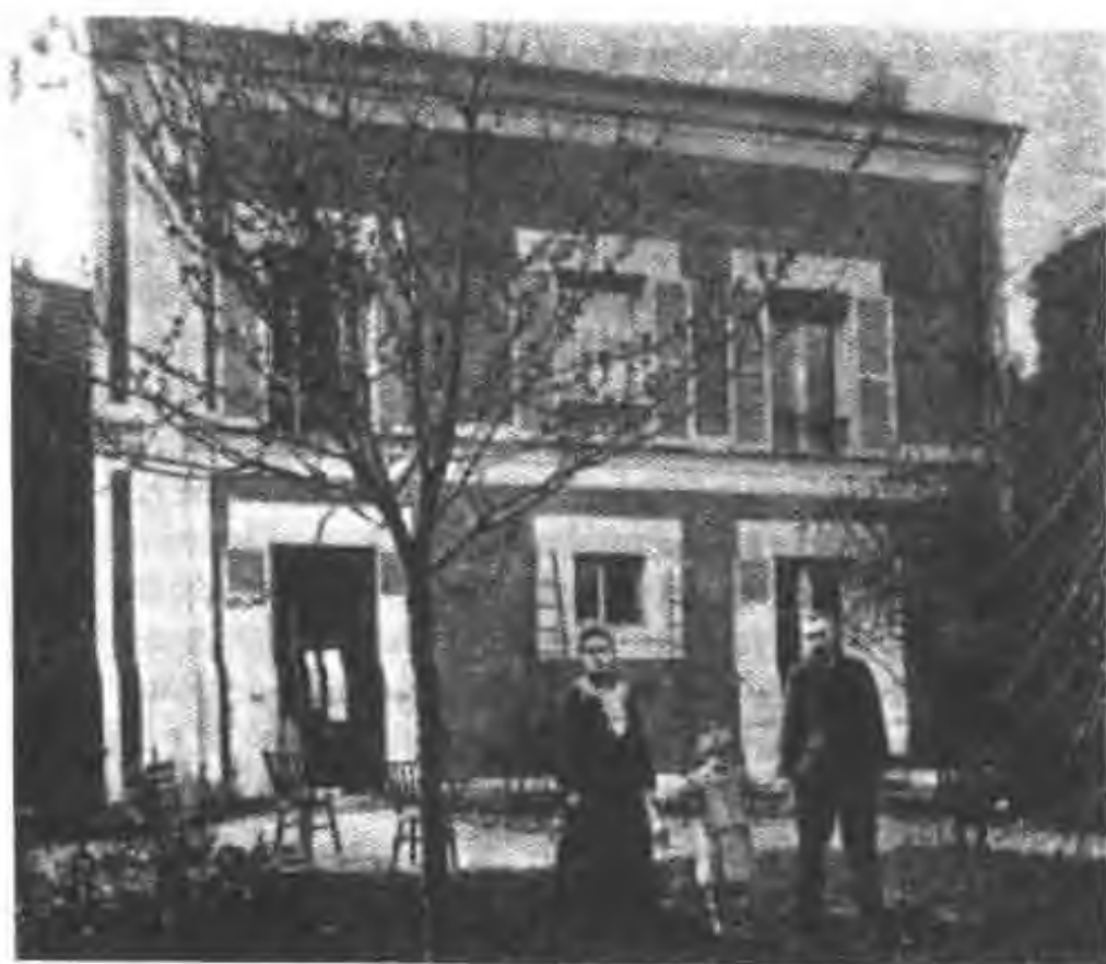
图 19 居里夫妇和伊伦娜(1904)