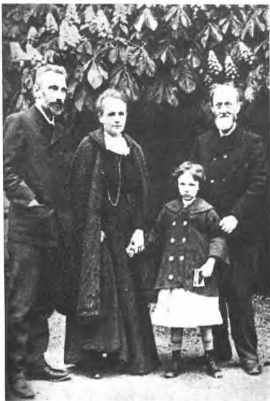
图 22 居里医生,皮埃尔,玛丽和伊伦娜(1904)