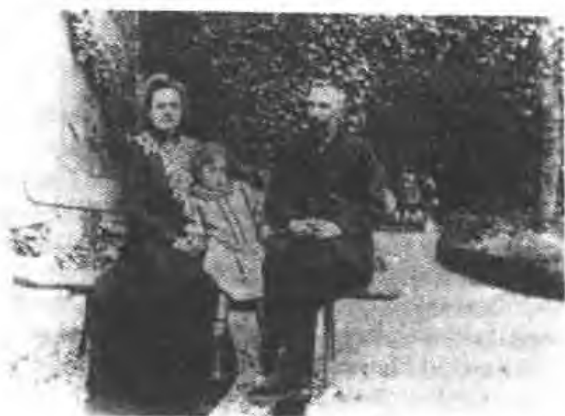
图 18 克勒曼大街 108 号的家庭花园