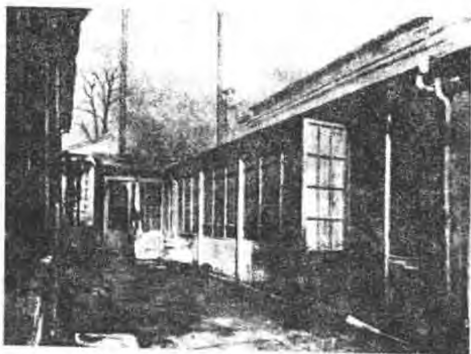
图 14 居里夫妇在这个小院里做释出酸性气体的实验