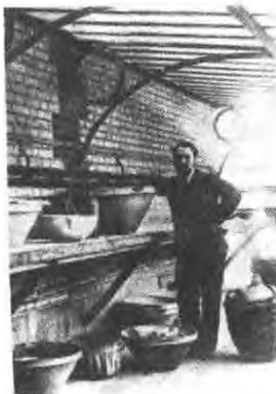
图9 安德烈·德 比尔纳，居里夫妇 的合作者。1934~ 1946年玛丽·居 里去世后成为居里 实验室的主任