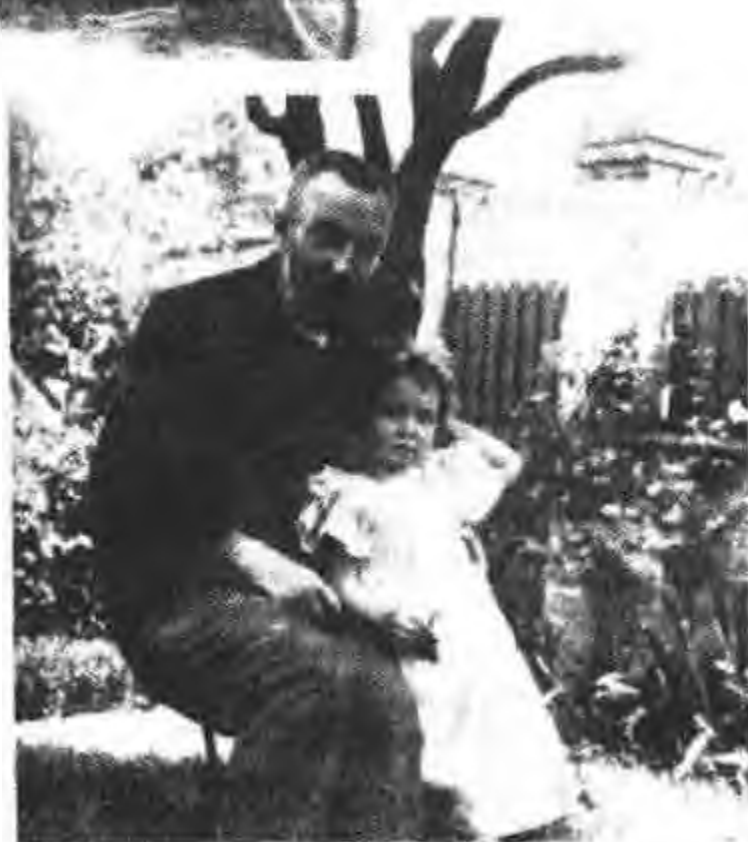
图 13 皮埃尔·居里和长女伊伦娜(1902)