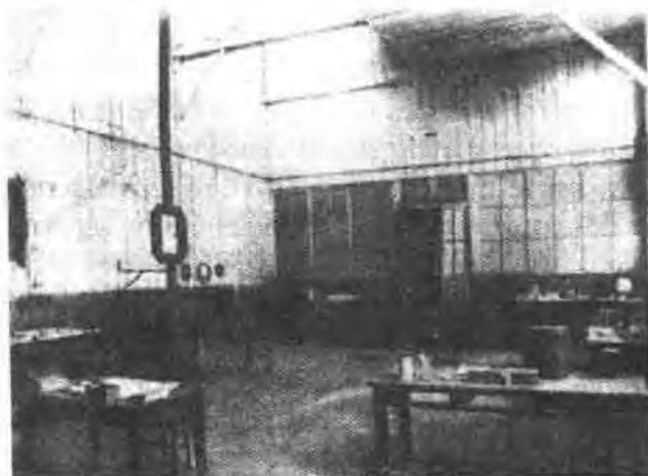
图 17 屋里唯一的取暖设施(一个火炉)和做化学实验用的桌子