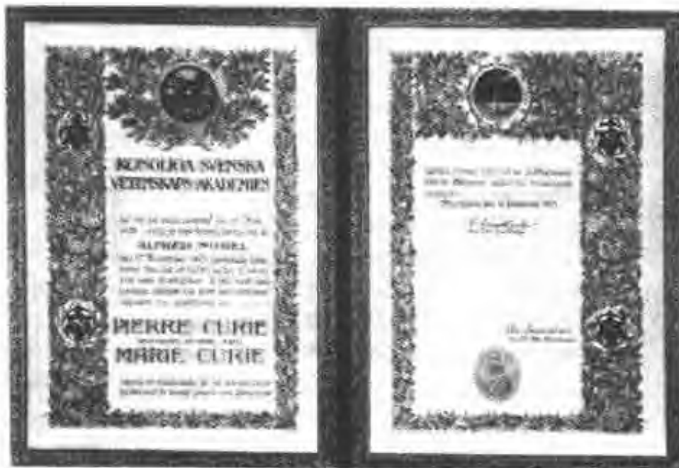
图 21 1903 年颁发给居里夫妇的诺贝尔奖证书