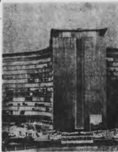
Mercado Común Europeo sede central —Bruselas

La repercusión de esta crisis bancaria sin precedentes en los últimos años pudo ser limitada por la intervención de las compañías aseguradoras de depósitos y mediante la venta de los bienes y propiedades de los bancos arruinados. Aún así arrastraron a su caída a sucesivos bancos y tuvieron una gran influencia en las impresionantes caídas registradas en la Bolsa de Londres y en Wall Street. En la primera el índice general de cotización de