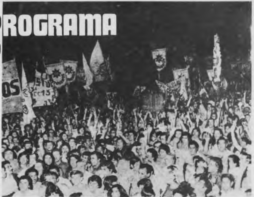
Movilización por la fórmula frejulista durante la campaña electoral del 11 de Marzo

Isabelita continúa con la labor de Perón. Si ya