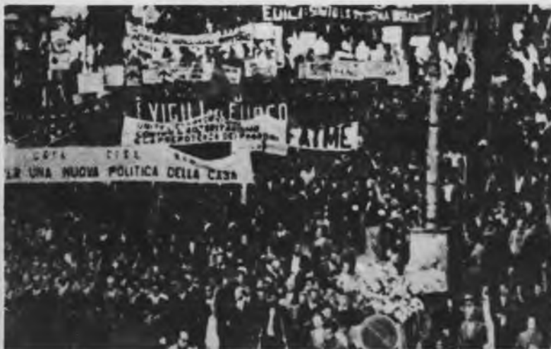
Los obreros italianos se movilizan contra la carestía.

La crisis actual es un momento del proceso revolución-contrarrevolución a escala mundial.