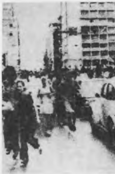
Las masas ganan las calles de Atenas

zación de la crisis. Desde el anuncio del retiro de Grecia de la OTAN, las manifestaciones han recobrado un formidable vigor en las calles de Atenas. Los campesinos de Creta han amenazado con tomar por asalto el campo militar norteamericano establecido en esta isla. 40.000 manifestantes fueron a recibir al dirigente Andreas Papandreu, dirigente burgués en el que las masas depositan muchas ilusiones y esperanzas como viejo y encarnizado enemigo de Caramanlis.