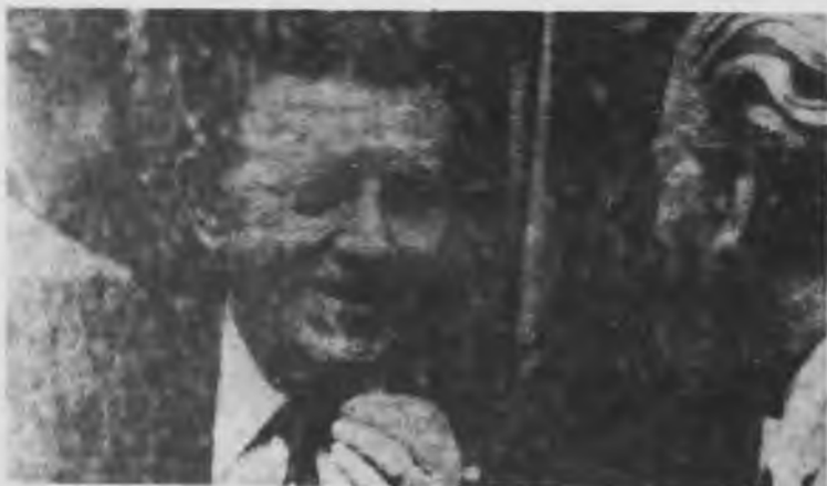
Gelbard no respeta "su" pacto social

El joven activismo de FATE que se ha destacado en el curso de esta lucha tiene una importante tarea sobre sus espaldas: garantizar el cumplimiento de lo resuelto en la Asamblea y preparar las elecciones de delegados por sección. Hay que consolidar lo conquistado, eliminando toda posible maniobra burocrática. Para ello hay que organizar tras el activismo a las secciones y preparar una lista unitaria y democrática, elegida en Asambleas previas de sección, para presentar a las próximas elecciones de delegados.