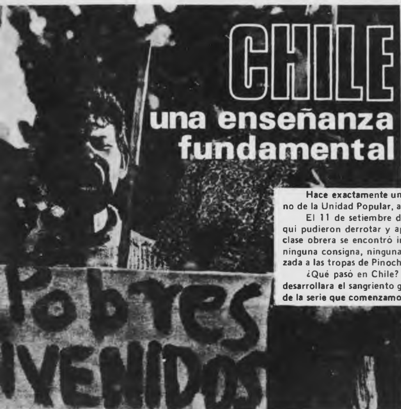
Los campesinos comienzan a ocupar los fundos

En agosto de 1969, más de 130 explotaciones agrícolas se encontraban en huelga