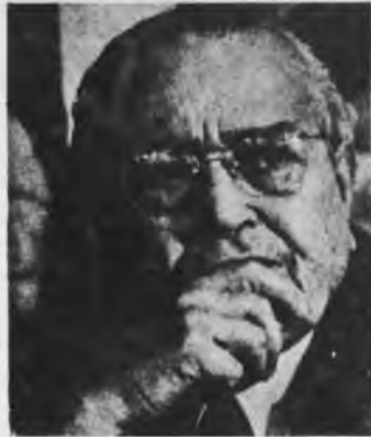
La confianza en los partidos burgueses liberales lleva a los Montoneros a un callejón sin salida

La decisión de los Montoneros significa la destrucción de todo tipo de lucha política por la conquista del proletariado (que en su mayoría aún no ha agotado su experiencia con el gobierno peronista) para una política de independencia obrera; significa el abando-