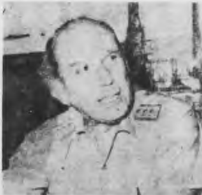
Fernández Maldonado Ministro de Minas y Energía

Los trabajadores exigen la expropiación de las empresas imperialistas y se movilizan en el cuadro de sus propias organizaciones de clase. El gobierno militar reprime esas movilizaciones y fracasan en el intento de subordinar y disciplinar a la clase obrera. Tal la lección que contiene la huelga minera de Perú.