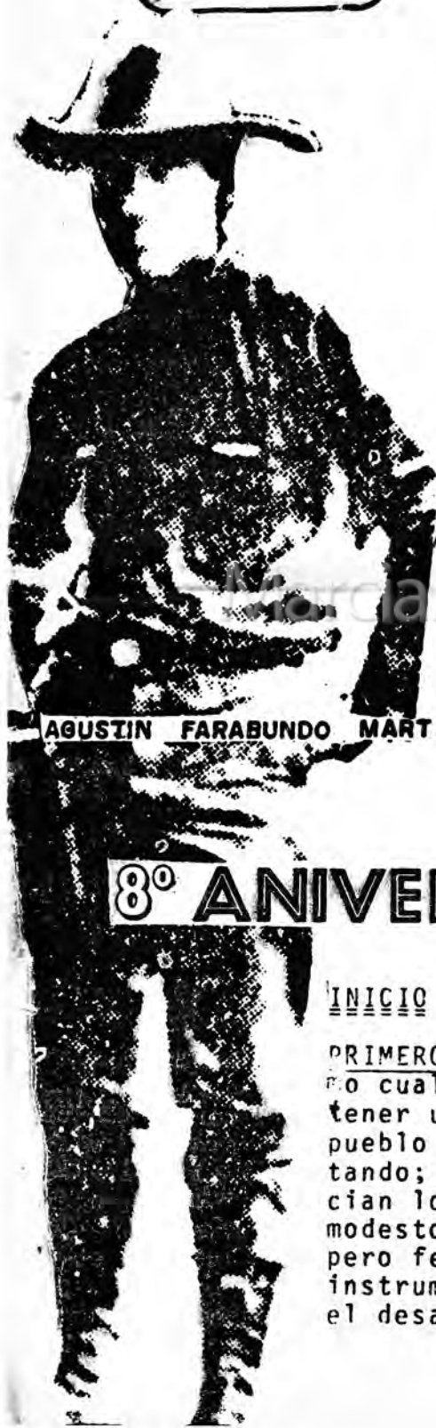
AGUSTIN FARABUNDO MARTI

AÑO 6 No. 66 ABRIL 1978 EL SALVADOR, C. A.