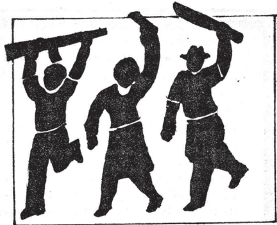
guesía y de las capas medias.

La combinación de la lucha armada con la lucha política ha desarrollado considerablemente el proceso revolucionario. La combatividad de las masas y su paso a nuevos escalones, al tiempo que enriquece las filas de la Organización, hacen surgir nuevas y más creativas modalidades de violencia revolucionaria para enfrentarse a la contrarrevolución y avanzar en la Guerra. Dando un salto de calidad en las luchas del pueblo, han surgido las MILICIAS POPULARES DE LIBERACION.