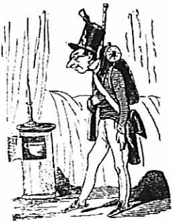
Monólogo de un Reseñista:

Hécteme aquí quince días en el campamento del aprendizaje de las maniobras.