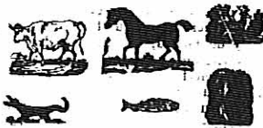
ADOLFO LEÓN GÓMEZ.

Tal del mundo en el proscenio anclan figurar mucho antes los rastrosos intrigantes que las águilas del genio.