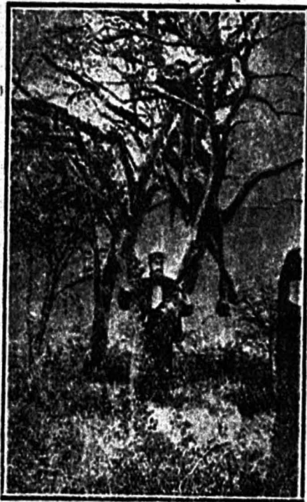
Efectos de un obus calibre 42 del ejército alemán