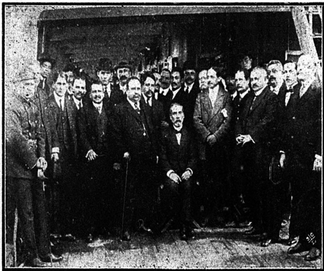
Los representantes de las Sociedades obreras a bordo del vapor "Orita"

ra trasladarse al vapor "Orita," que debe conducirle a su patria.