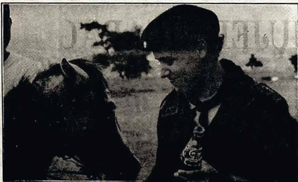
"Nosotras, las mujeres en Nicaragua, somos el 50.80%." En la foto, la comandante de la revolución, Dora María Téllez.

"Es cierto, nosotros no podemos tapar el sol con un dedo. El aborto se da. Y en nuestra legislación el aborto es castigado. Me refiero a nuestra legislación en Nicaragua, porque no es mi legislación, que es la revolucionaria, sino que es la del pasado, pero es mi pasado de todos modos. Entonces, en la legislación del pasado el aborto está penado. Es aceptado nada más el aborto terapéutico. Es decir, cuando el médico señala que puedes morir, o morir los dos. Sólo en ese caso es aceptado, y es peor: no es la mujer que da su consentimiento; se lo tienen que pedir a tu compañero. Entonces, encima de que está penado y que sólo es aceptado el te-