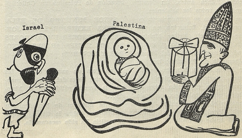
EL PAPA EN TIERRA SANTA.—La historia del natalicio de Jesús... y la espera de una oportunidad para ultimarlos.

En la fotografía podemos ver a Harry Truman, osteniendo sonriente el obsequio de Weizman, y a Weizman agradeciendo el servicio hecho al nuevo "estado" creado por el pillaje y agresión sionistas.