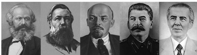
Karl Marx, Friedrich Engels, Vladimir Lenin, Joseph Stalin, Enver Hoxha