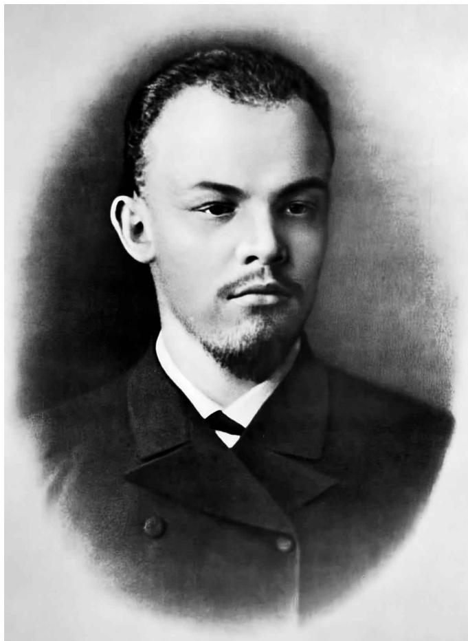
3. 0. ლენინი 1890 — 1891