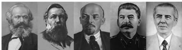
Karl Marx, Friedrich Engels, Vladimir Lenin, Joseph Stalin, Enver Hoxha