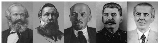
Karl Marx, Friedrich Engels, Vladimir Lenin, Joseph Stalin, Enver Hoxha