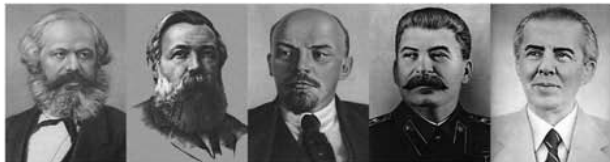
Karl Marx, Friedrich Engels, Vladimir Lenin, Joseph Stalin, Enver Hoxha 5 Classics of Marxism

Comintern (Stalinist-Hoxhaists) http://ciml.250x.com