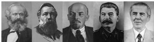
Karl Marx, Friedrich Engels, Vladimir Lenin, Joseph Stalin, Enver Hoxha