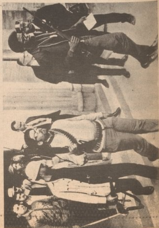
Cornell University, 1969