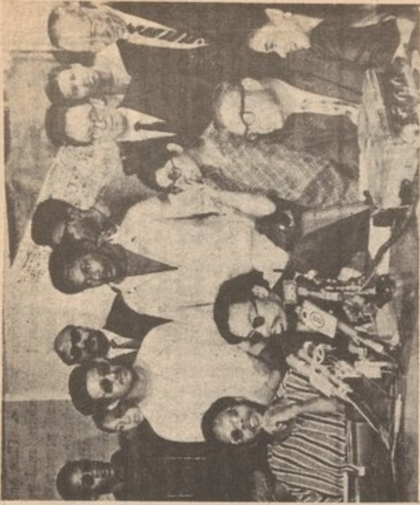
City College, N.Y.--1969 struggle for Open Admissions