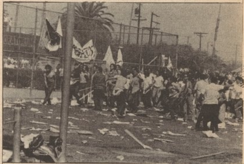
Chicano Moratorium against the war August 29, 1970.

Tens of thousands of workers struck in the agriculture and canning industries, in berry, onion, celery, cotton fields, and in the railroads and mines. The vicious class nature of the bourgeois state, struggling to preserve monopoly capitalism was blatant as troops were used against strikers, imprisoning the most advanced and class-conscious elements, or murdering them. Over one million Chicanos, citizen