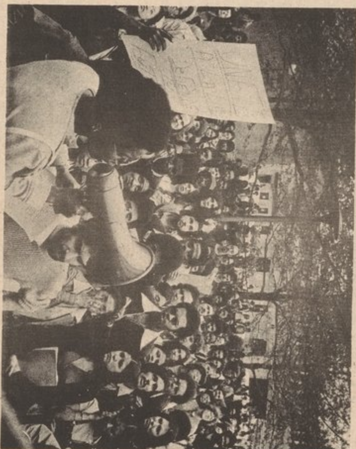
City College, N.Y.--May 1973 takeover by Third World CUNY Coalition