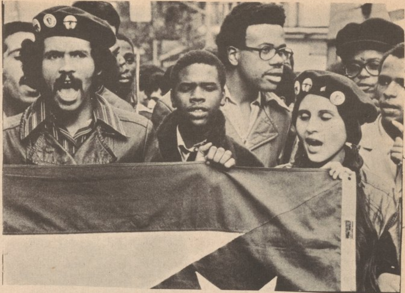
On October 30, 1970, 10,000 people, many students and youth, marched to the U.N. demanding liberation of Puerto Rico.

By the 1960's, the U.S., which had already been defeated in Korea, was unable to stop the victorious advance of the revolutionary masses of Cuba and had begun its military aggression in Indochina and the Middle East. As an imperialist power the U.S. was beginning to lose many of its "possessions" and headed towards one of its worst crises ever. Domestically, the imperialists were faced with a worsening economic