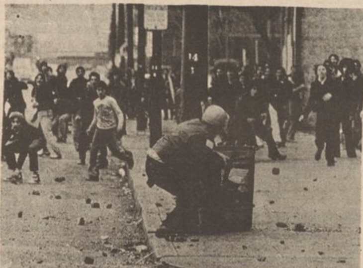
H.S. students rebellion in Chicago.

Students and youth too have been hit by severe attacks because of this crisis. Students and youth are a strata in class society--i.e., they are not a class of themselves, but rather are composed of students and youth from different classes, such as the proletariat, the petty-bourgeoisie,