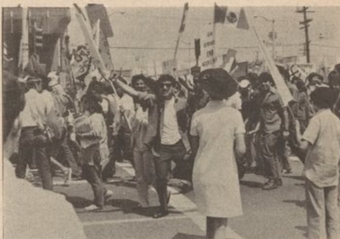
Chicano Moratorium Against the War, August 29, 1970.

Within the Southwest region, the Chicano and Indian peoples have historically developed under the distinct material conditions of slavery under Spanish colonial rule, and then under feudal relations of production and oppression by Spanish feudal landlords under both the rule of Spain and Mexico.