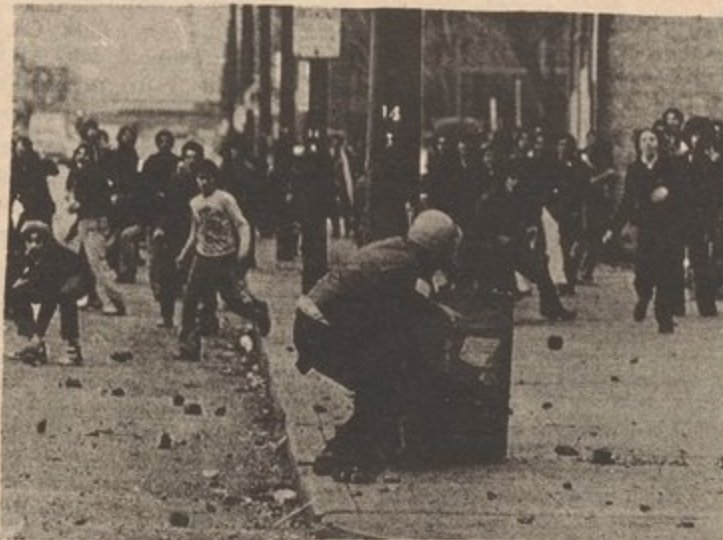
Rebelion de estudiantes de escuela superior en Chicago.

Los efectos de la presente crisis capitalista en la clase trabajadora y las masas oprimidas pueden ser notadas con toda claridad. La creciente inflación, el desempleo, los despidos y cortes presupuestarios no han estado llegando a su fin, como alega la burguesía, sino que han seguido aumentando. La "crisis fiscal" de la ciudad de N.Y. nos muestra cómo la clase obrera sufre, y cómo los capitalistas financieros se benefician de esta crisis. Los bancos y capitalistas monopolistas continúan haciendo ganancias mientras los obreros de la ciudad son despedidos, tienen sus salarios congelados por tres años y se