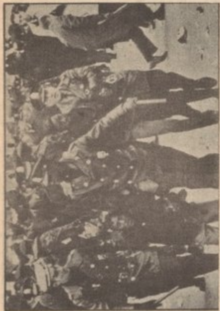
Philadelphia high school rebellion, 1967