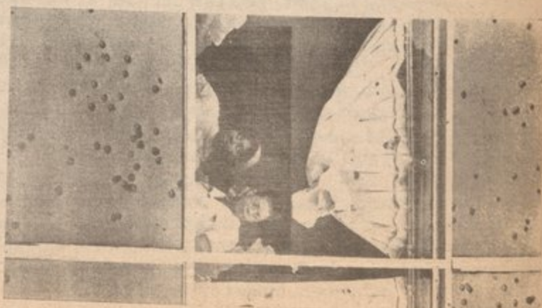
2. Black students murdered at Jackson State, May 1970