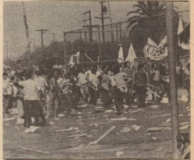
MORATORIO CHICANO CONTRA LA GUERRA agosto 29, 1970

Durante los años 30tas. la creciente militancia de la clase obrera por todo el mundo chocó directamente con las fuerzas y tácticas más agresivas del capital financiero.