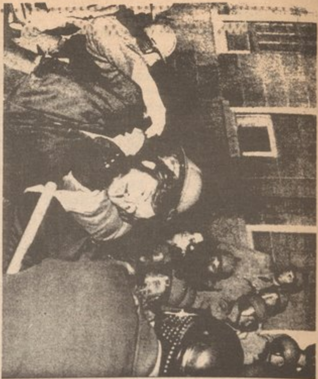
Harvard anti-ROTC demonstration, April 1969