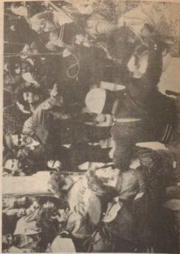
Springfield, Mass., May 1970