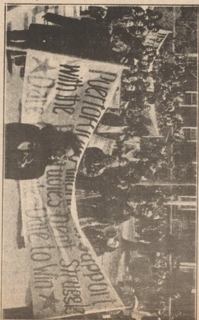
Brooklyn College, 1975--demonstration against attacks on Puerto Rican Studies