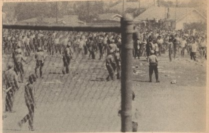
CHICANO MORATORIUM AGAINST THE WAR AUGUST , 29, 1970

In 1947 the farm workers struck in Arvin against the DiGiorgio Fruit Company only to have the strike broken by the bourgeois courts, while hundreds of workers were deported to Mexico.