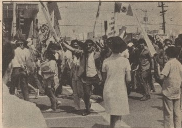
MORATORIO CHICANO CONTRA LA GUERRA agosto 29, 1970

En el 1848 el pueblo vió a la clase terrateniente feudal, representada por el general Santa Ana, entregar a California, Nuevo Mexico, Arizona, Colorado, Nevada, y parte de Utah a la burguesía de EE.UU.