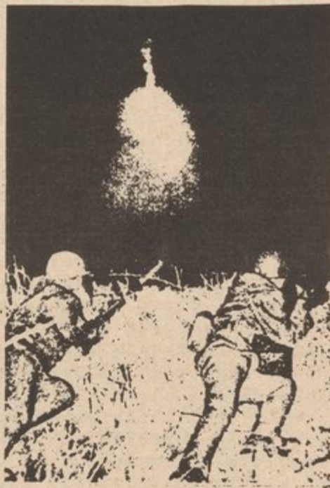
U.S. Imperialist aggressors are hell-bent on malicious armed provocations against our side on the Military Demarcation Line in gross violation of the Korean Armistice Agreement

rando su planta para evitar entrar en negociaciones. Podía destruir las tesorerías de uniones con demandas en cortes; el mantener las fábricas libre de uniones con amenazas legales contra los obreros; el emplear espías de las compañías en uniones que, por la letra de la ley, no podían ser botados mientras pagarán sus cuotas. El Patrono podía embaucar la democracia de la unión acusando cualquier trade-unionista de ser comunista, haciendo su elección poco probable y sentando las bases de un procedimiento de perjurio si fuese electo." (tomado de Labor's Untold Story , pp. 348)