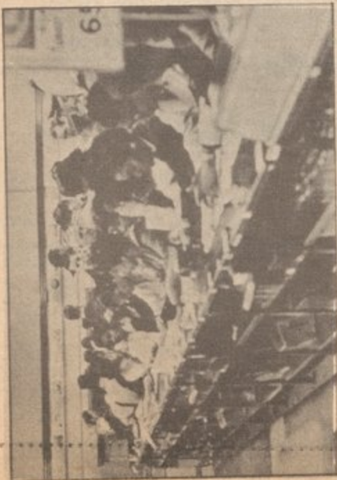
First historic sit-in in Greensboro, North Carolina, 1960