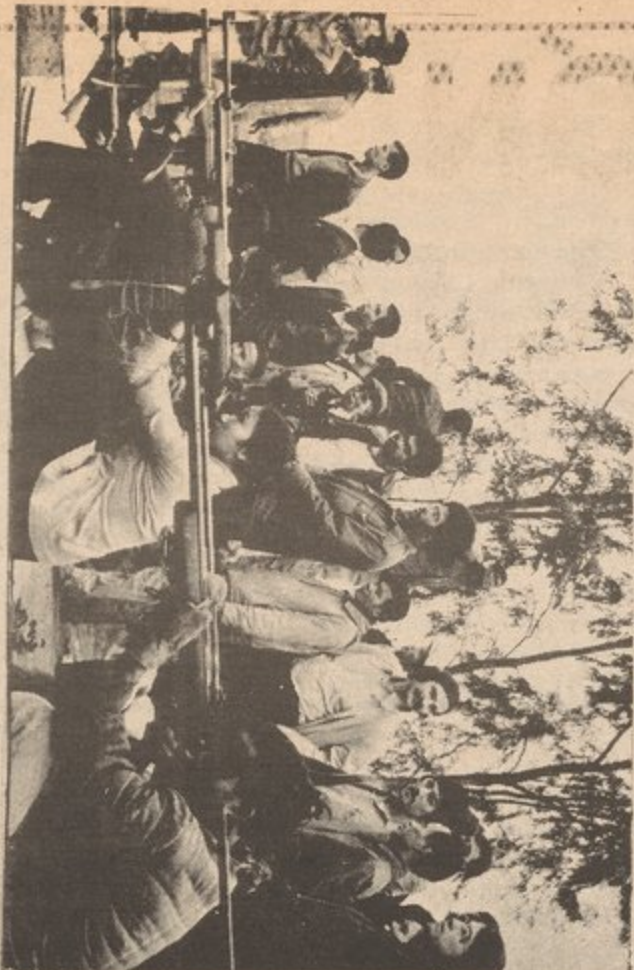
North Vietnam, 1970--U.S. student delegation included Puerto Rican Student Union