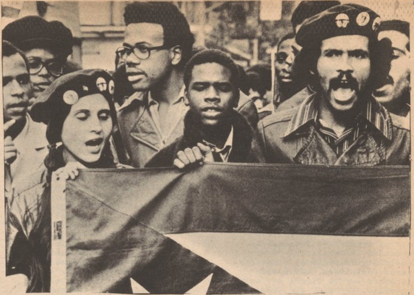
Más de 10,000 personas marcharon a la O.N.U. el 30 de Octubre del 1970 demandando la liberación de Puerto Rico, muchos de los cuales eran estudiantes y jóvenes.

Esta situación ha sido usada para satisfacer las necesidades de los capitalistas. Recientemente, la comisión Keppel, preparada por Rockefeller, dijo que habían muchos grados de Bachiller en el mercado de trabajos, y que había necesidad de que más estudiantes de colegio ingresaran en colegios comunales de dos años para así poder encarilar estudiantes en las necesidades laborales de los capitalistas. El hecho de que haya demasiados con grado de Bachillerato puede verse al notar que muchos graduados no pueden conseguir trabajos, que terminan por trabajar en trabajos de servicio, quedan desempleados, ingresan a programas de entrenamiento, o se unen al ejército mercenario voluntario. Lo mismo se aplica a los graduados de escuela superior. El promedio de los estudiantes que se dan de baja de escuelas superiores y de universidades ha