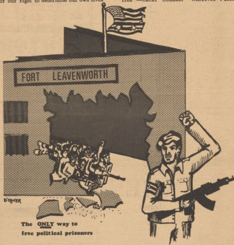
The ONLY way to free political prisoners

Also, we must not forget the many other nationalist warriors who are still in federal jails (at last count there were 37) or on parole. They too are political prisoners who are treated like prisoners of war and not given any of the small rights that prisoners can get. All of them, including Collazo, must be set free unconditionally. "I don't want a foreign court or any other foreign agency to curtail my rights or tell me how to conduct myself in my own country"—Oscar Collazo. What lays ahead must also be clear to us. "When I walk out of this prison's doors, I won't deserve that title (free man). Only when my country has joined the concert of free nations will I be able to call myself free"—Oscar Collazo. Wherever Puerto