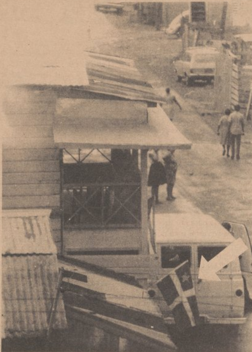
oficina del partido

Las redadas en los arrabales son el mejor ejemplo del abuso policiaco en nuestras comunidades.