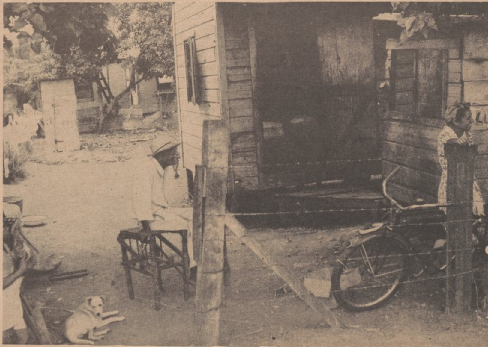
Sugar workers' homes along the roadside