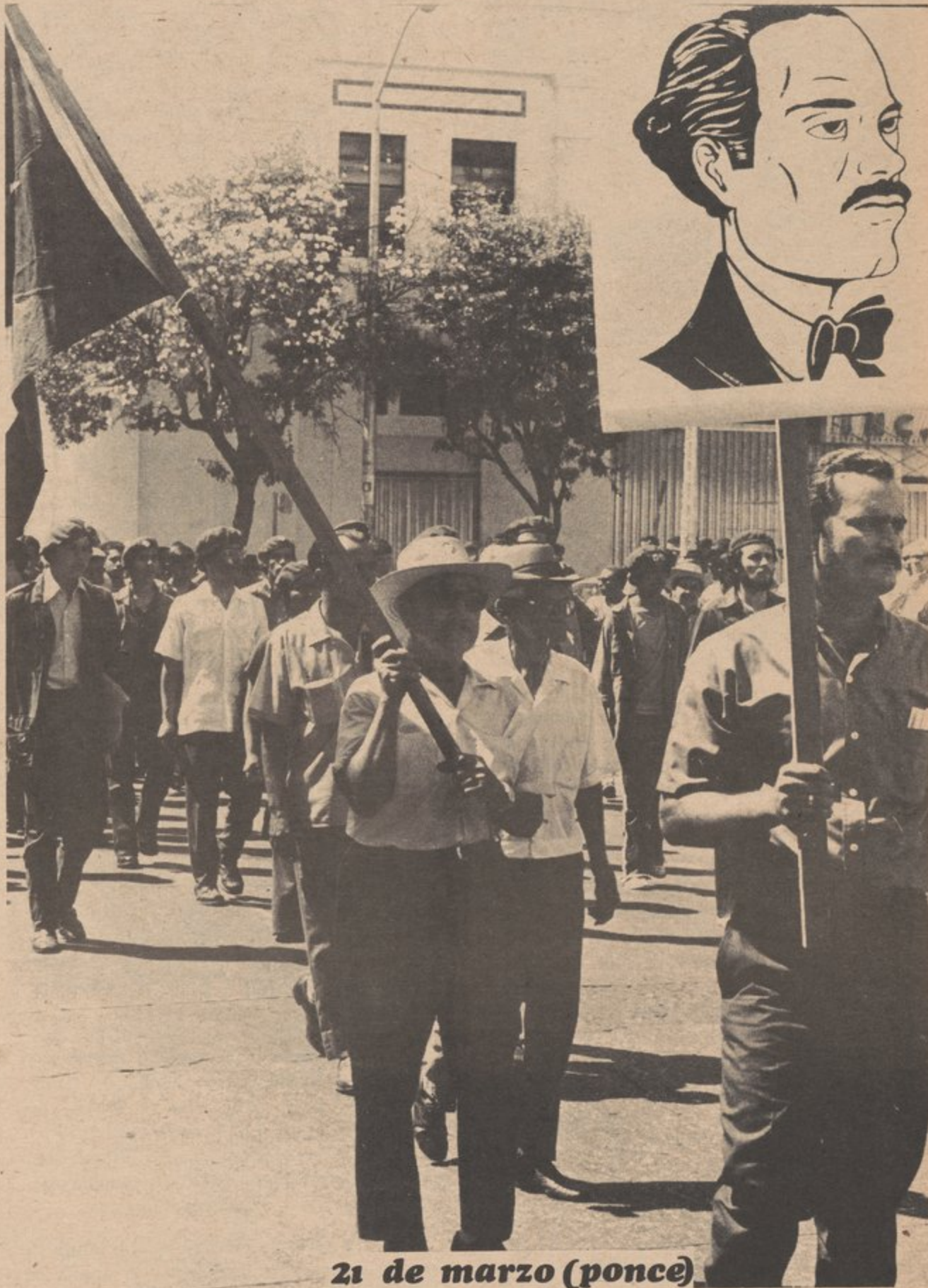
21 de marzo (ponce)

Por el lado positivo, el Partido ha crecido muchísimo en este año, como ha crecido todo el movimiento puertorriqueño. Hemos tenido