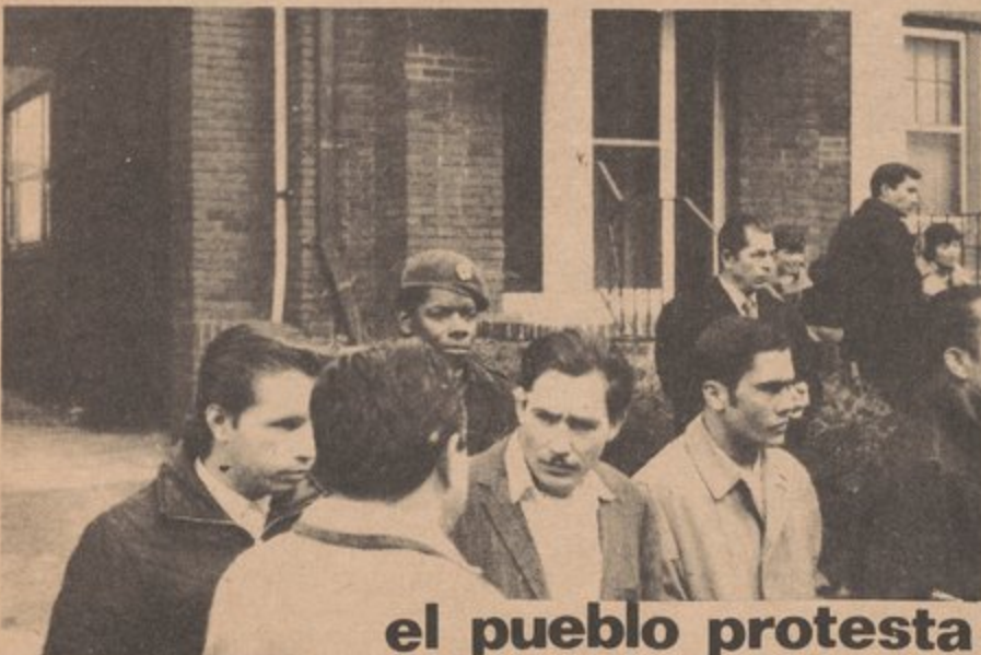
el pueblo protesta