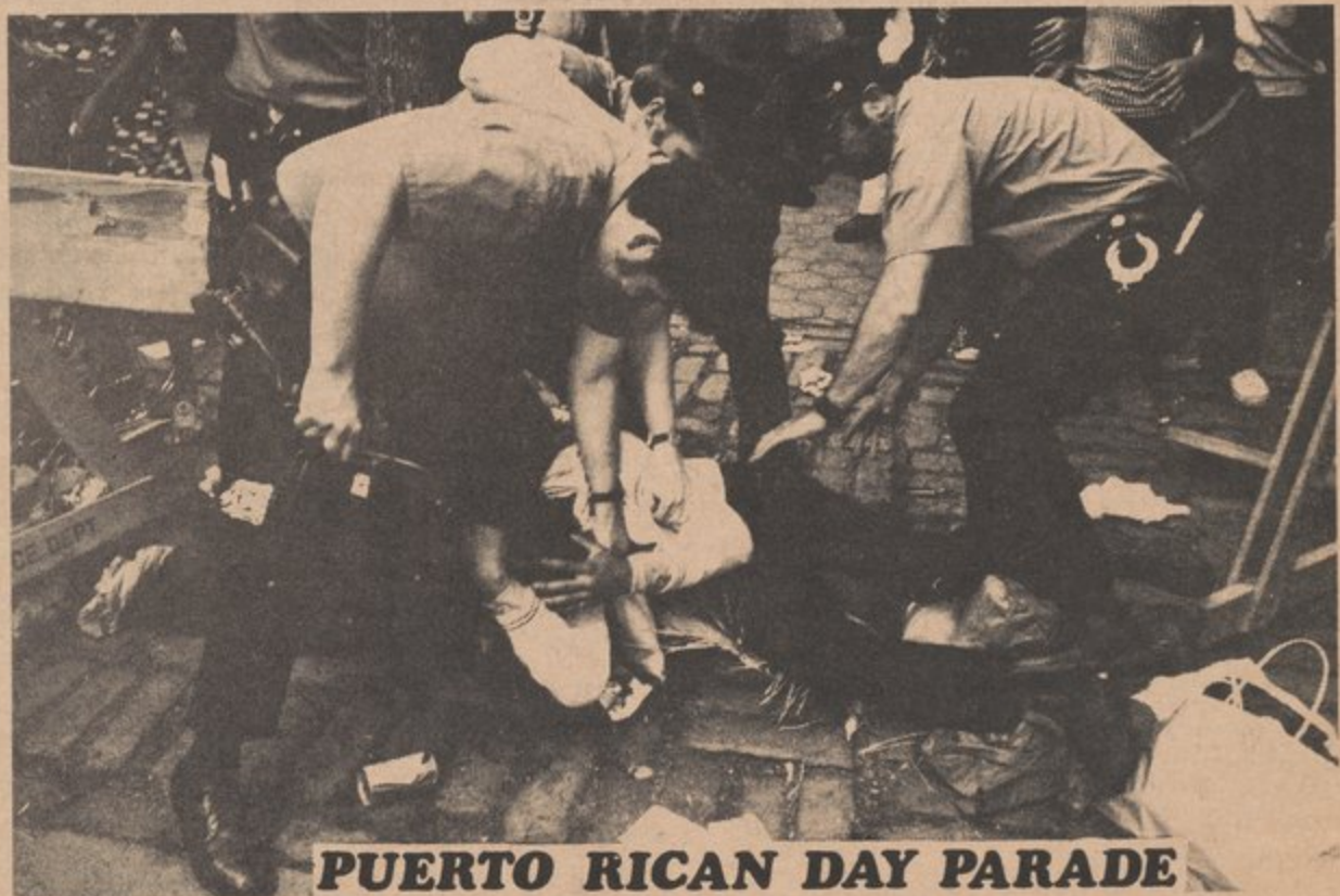
PUERTO RICAN DAY PARADE