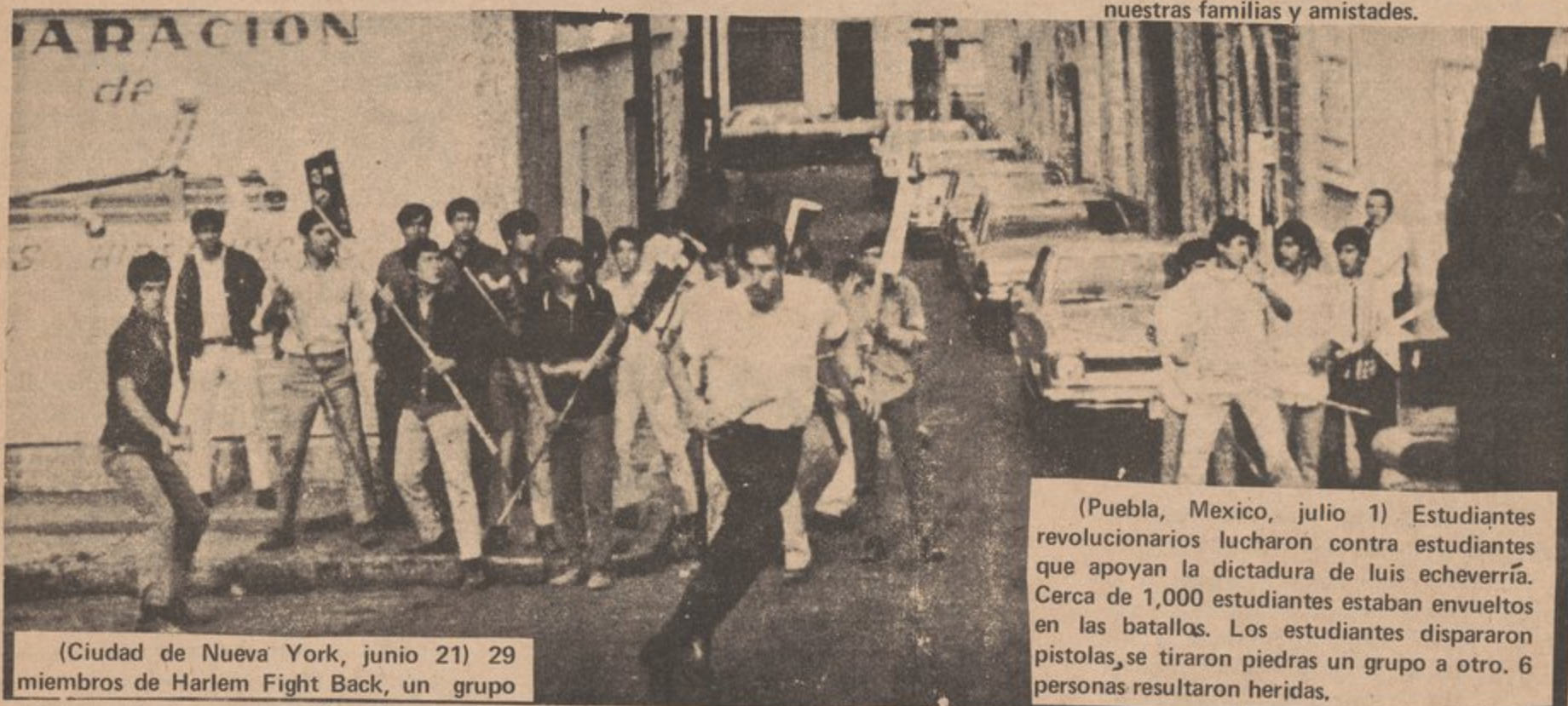
(Ciudad de Nueva York, junio 21) 29 miembros de Harlem Fight Back, un grupo

¿Qué es lo que sucede que nuestros hermanos y hermanas están siendo asesinados a tiros en nuestras calles? Cada comunidad debe organizarse para defenderse y luchar contra aquellos que pretendan hacer daño a nuestras familias y amistades.