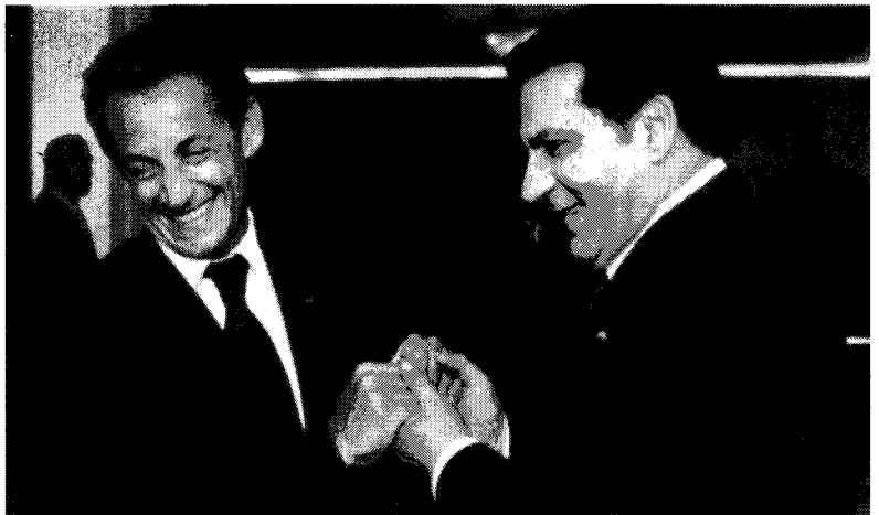
Les deux présidents Sarkozy et Ben Ali

Mohamed Bouazizi était devenu, à l'âge de dix ans, le principal soutien de toute sa famille en travaillant comme vendeur de légumes au marché. Il avait abandonné ses projets d'études et quitté l'école à 19 ans, sans diplôme, pour pouvoir nourrir sa famille et offrir à ses jeunes frères et sœurs une chance de rester à l'école. Ceux qui le connaissent évoquent des années d'humiliations et de harcèlement de la part de la police locale, qui lui confisquait ses marchandises et lui infligeait des amendes sous prétexte qu'il n'avait pas de patente. Le 17 décembre, la police lui avait confisqué ses marchandises, elle avait renversé son étal et l'avait tabassé. Moins d'une heure plus tard, alors que les responsables locaux avaient refusé d'enregistrer sa plainte, il s'immolait par le feu. Sous le coup de l'indignation, des pro-