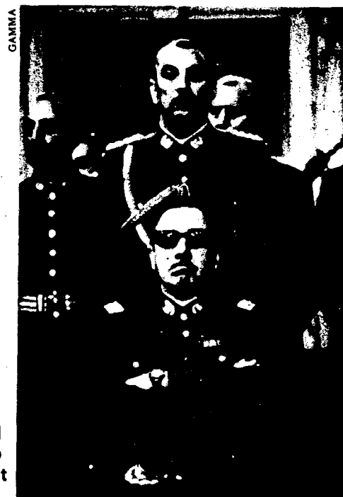
General Augusto Pinochet

Pero por supuesto en la situación chilena sería manifiestamente absurdo pedir ni siquiera apoyo militar al gobierno de la UP, que ya ha sido aplastado.