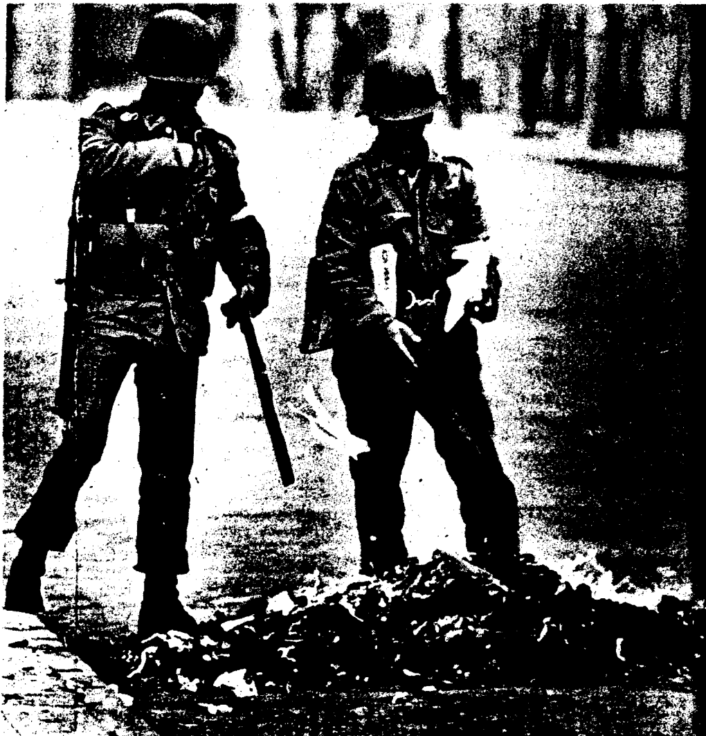
Soldados de la junta queman "literatura subversiva"