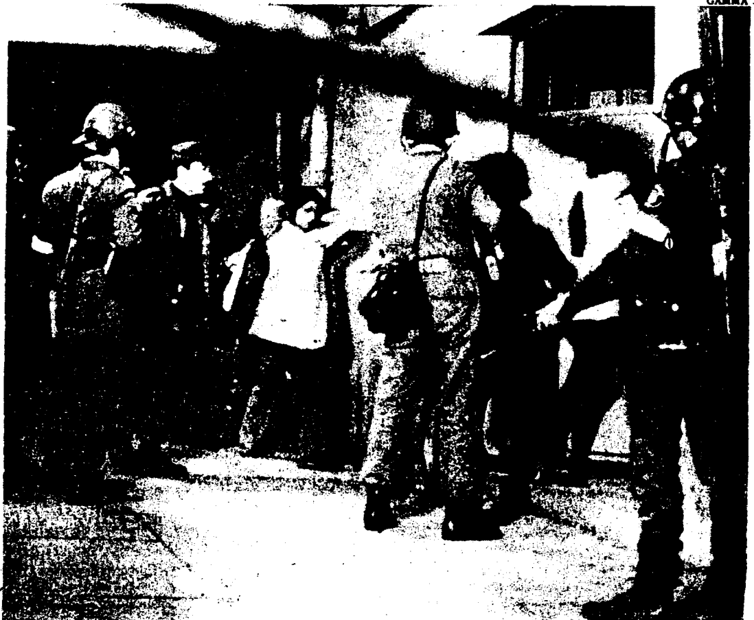
En el Estadio Nacional

En una reciente octavilla advertimos de nuevo: "Un baño de sangre se prepara en Chile mientras que las fuerzas derechistas intentan crear un caos político y económico, como preparación para un golpe contrarrevolucionario.... Solamente una revolución obrera puede prevenir esto, y el primer obstáculo que se opone es el gobierno del frente popular de Allende. " Al