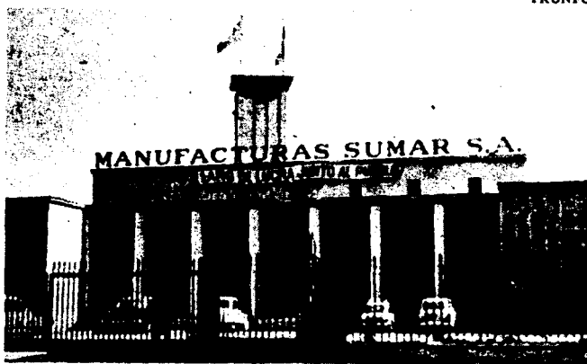
Fábrica textil Sumar

tenía el poder, las fuerzas armadas utilizaron la nueva ley para llevar a cabo una redada en la oficina del propio partido de Allende, los socialistas, "en busca de armas ilegales". Como consecuencia de la política de la UP la clase obrera chilena se ve ahora enfrentada a la fuerza total del ejército, marina, aviación, y carabineros, sin tener en su poder más que unas cuantas ametralladoras ligeras.