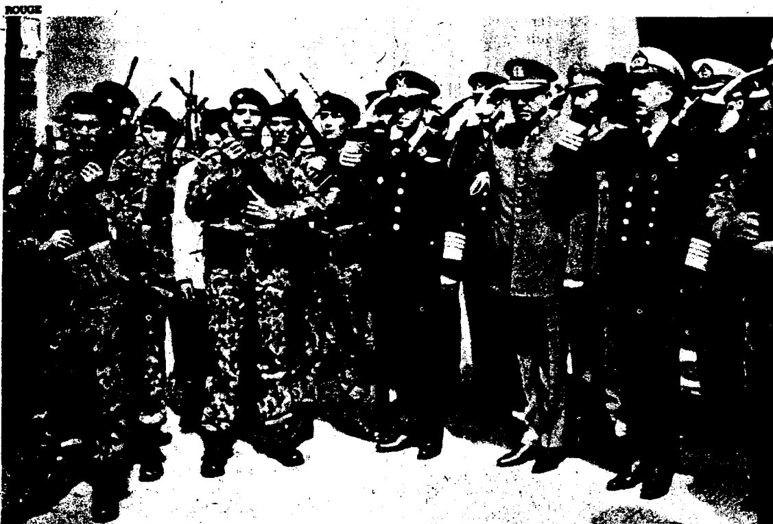
La junta saliendo de misa el día de la independencia nacional el 19 de septiembre.

El propósito mismo del frente popular es engatusar a los obreros a que se crean que es posible mejorar su situación sin derribar el orden burgués, sin enfrentarse a las fuerzas armadas o sin romper con los partidos capitalistas. La UP no era un gobierno obrero, ni un "gobierno reformista", sino un frente popular que ataba a la clase obrera al capitalismo y