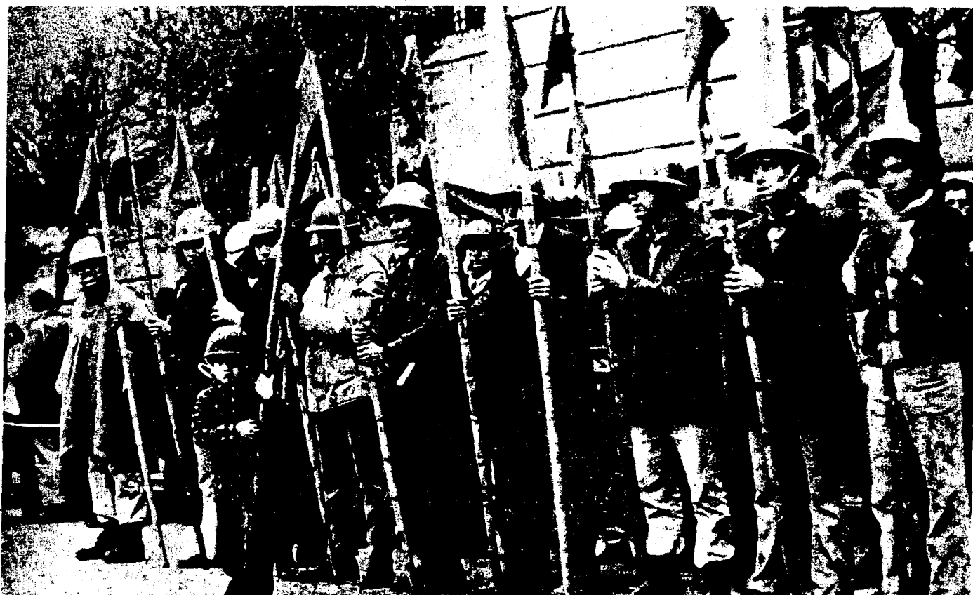
Milicia obrera "armada" al estilo "vía pacífica al socialismo".