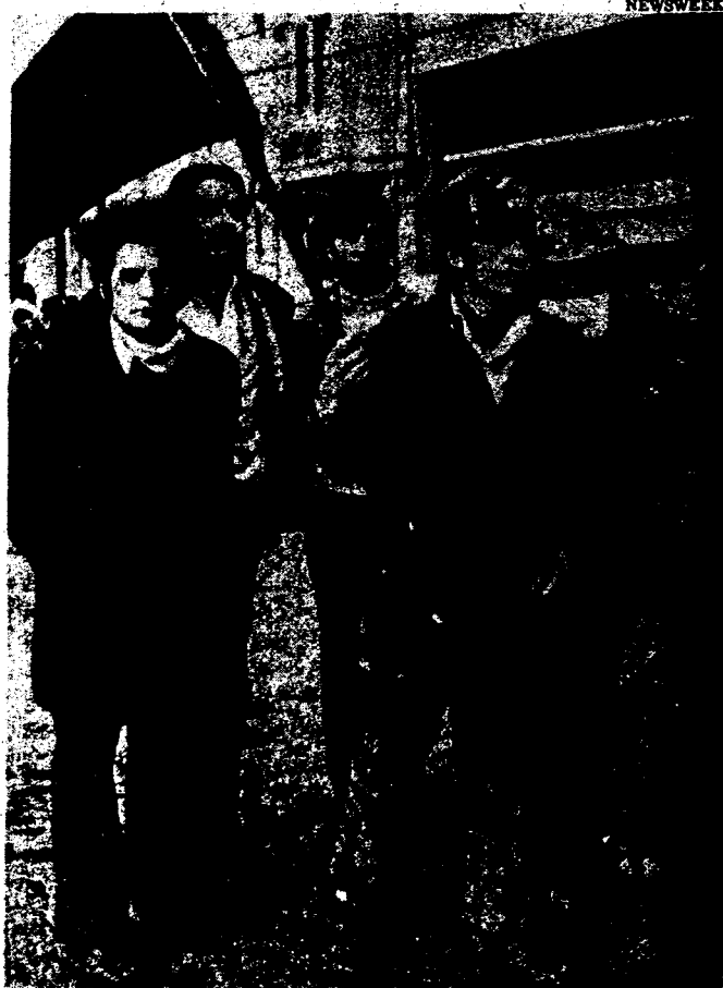
Mineros durante la huelga de mayo de 1973.

El camino a la victoria será arduo. La ausencia de un partido revolucionario de vanguardia es hoy el problema fundamental que afrontan los obreros chilenos. Esta vanguardia debe ser forjada a través de una lucha acerba por un programa de clase, contra el frente popular y los reformistas de la UP que están haciendo lo imposible por estrangular la revolución. Como Trotsky escribió sobre España: "PARA TENER EXITO EN TODAS ESTAS TAREAS, TRES CONDICIONES SON NECESARIAS: UN PARTIDO; OTRA VEZ UN PARTIDO; Y DE NUEVO, UN PARTIDO." ■