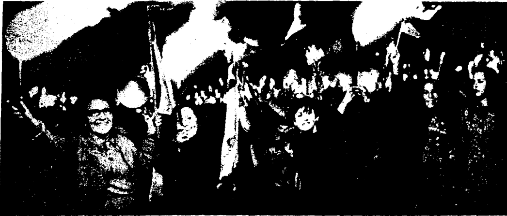
Manifestación de amas de casa chilenas contra el gobierno de Allende en 1972.

millones de dólares en bonos emitidos por el previo gobierno de Frei: