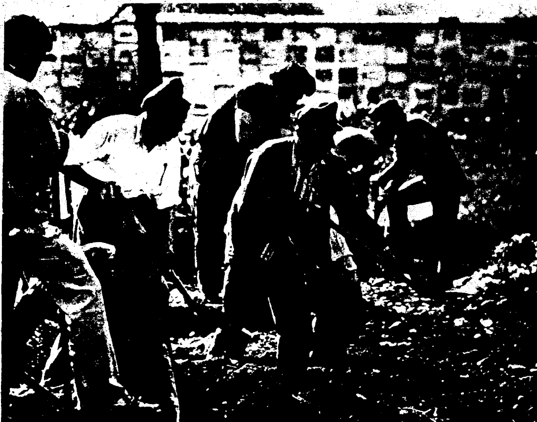
Cavando tumbas después del golpe.

De todos los partidos de la Unidad Popular, el Partido Comunista estalinista era el más desvergonzado en su política de colaboración de clases con los llamados sectores "anti-imperialistas" de la burguesía. Hasta el último momento pidieron la inclusión de la Demo-