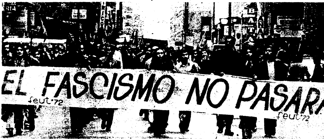
Estudiantes se manifiestan contra la derecha.

Nacional ultraconservador, ni los almirantes y generales gorilas; ni aún los demócratas cristianos, que apoyan la coalición nacionalista-fascista-militarista al llamar a sus "asociaciones profesionales" (médicos, pilotos, tenderos y propietarios de camiones) a un paro patronal. Los autores principales de este crimen son los agentes de los patronos en el movimiento obrero—los líderes reformistas del Partido Comunista, el Partido Socialista y la federación laboral CUT, el Compañero Presidente Allende y el gobierno del frente popular, que se han puesto de acuerdo en no entrometerse en el cuerpo de oficiales de las fuerzas armadas, que han rehusado expropiar la propiedad de los capitalistas industriales; que han intentado acabar con la reciente huelga de mineros ametrallando a los huelguistas; que han intentado repetidamente persuadir a los demó-