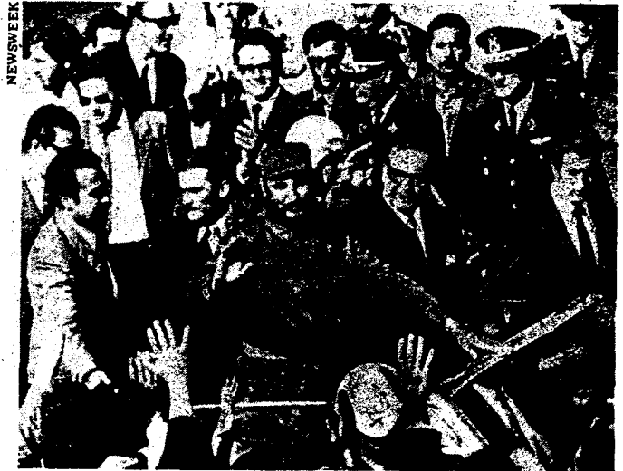
El "jefe máximo" de la Revolución Cubana recibido por los militares chilenos en 1971.

"...en los numerosos pronunciamientos que realizó la Revolución en relación al panorama general de América Latina, nosotros siempre veíamos la situación chilena con un carácter diferente.... De manera que nunca hubo contradicción alguna entre las concepcio-