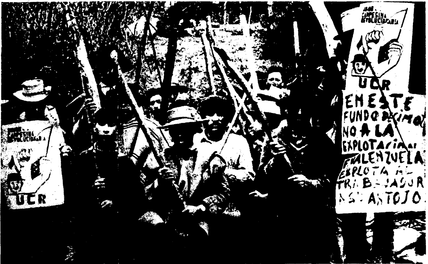
Toma de una hacienda cerca de Nacimiento.