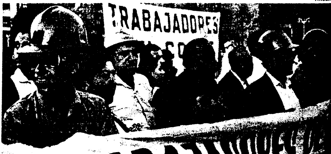
Militantes de la Federa- ción del Cobre de la CUT.

matiz: parece que el eslogan "Abajo con la dictadura" "expresa un sentimiento general" pero "como frase, por sí mismo, no es una posición para unir a la mayoría en una acción de masas concreta". En su lugar, la demanda "fin al estado de guerra interna" es "una consigna de agitación...que puede preparar para la acción de masas, que unirá seriamente a la mayoría..." ( Daily World , 16 de enero de 1974).