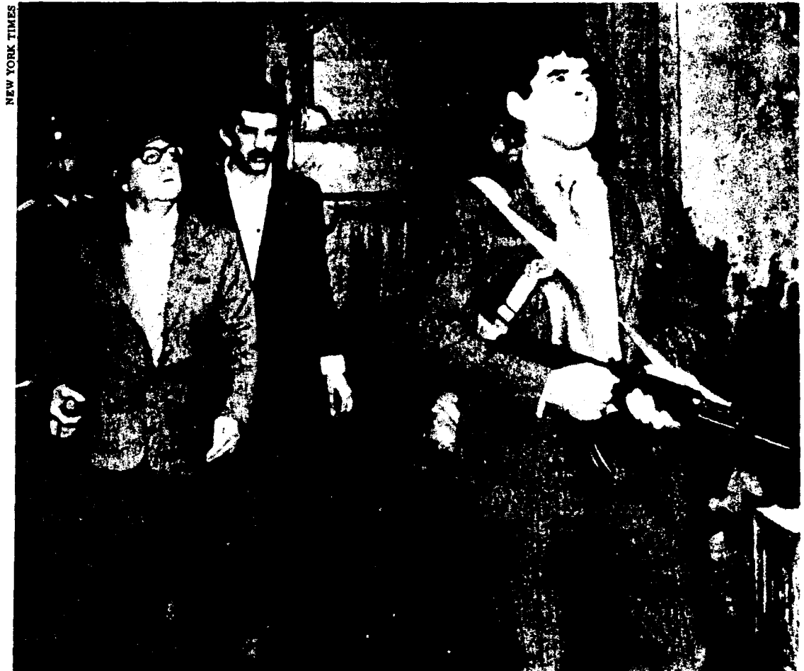
En el palacio presidencial, esperando al "ejército leal". Nunca llegó.

—S. Allende, "Primer mensaje al Congreso", diciembre de 1970