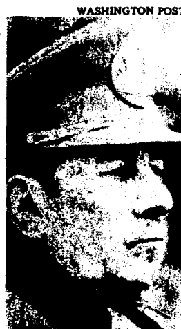
General Carlos Prats González

Frentes populares no son nada nuevo en la historia de Chile; el país ha pasado por varios entre los años 1938 a 1948, empezando por la coalición PC-PS-Radical bajo Pedro Aguirre Cerdá (en el cual Allende mismo fue ministro por el PS). Varias reformas de la beneficencia social fueron llevadas a cabo bajo estos gobiernos de colaboración de clases, pero el resultado neto para el proletariado chileno fue la derrota: los sueldos cayeron de 27 por ciento a 21 por ciento de la renta nacional durante 1940-1953, mientras que los beneficios aumentaron tremendamente; se fortalecieron los partidos de la derecha y se desorganizaron los sindicatos. El principio del fin vino en 1947 cuando el Presidente Videla proscibió a su asociado en la coalición, el PC, (supuestamente a causa de la huelga de los mineros) y detuvo a cientos de líderes obreros en campos de concentración. (El PS ayudó a romper la huelga y después entró en el gobierno de Videla.) Durante todo el período no se hizo nada sobre la reforma agraria.