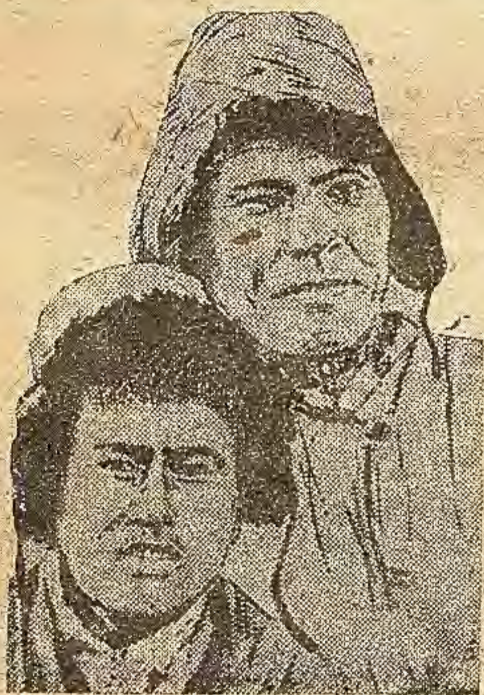
Balqactьn pastьrojkinin ekpindi çumьsekti.

Birinci-çəne en negizgi-Ortalьq partьja kəmiyyətinin tapsьrqaьnь mekteptin „negizgi kemciligin“ çojuv volatьn. Aldь men tysinip aluv kerek, Mektep-