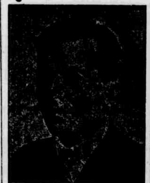
Luiz Carlos Prestes

gral á sua essencia e seu objetivo patriótico e elevadamente anti-fascistas é nascido da completa concordancia de pontos de vista, em torno dos principais assuntos abordados na entrevista, entre Prestes e os comunistas, e, logo, entre Prestes e mim. Estou, pois, de acordo com Prestes em tudo o que ele diz sobre os perigos que represen-