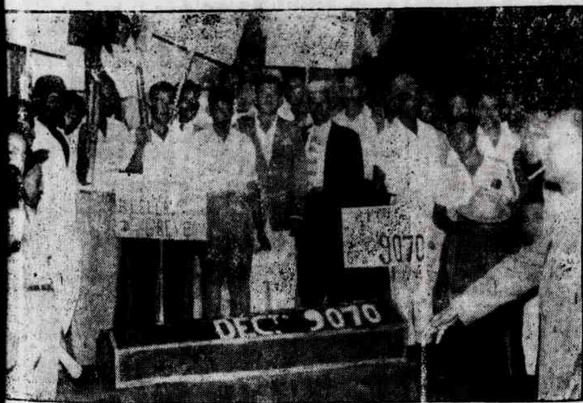
Agente apanhado na Praça Oito, vendo-se os líderes sindicais e o caixão do famigerado decreto 9.070, solenemente atirado ao mar