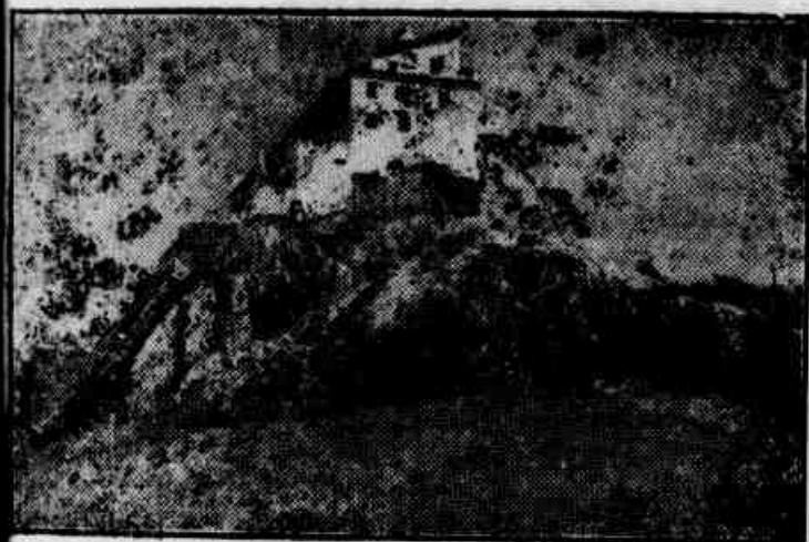
Foto: — O histórico mosteiro da PENHA. Ao penhasco in- terme acorram, a partir de hoje, milhares de fiéis de todos os cantos do Estado para participarem dos festejos do IV Centenário da devoção de NOSSA SENHORA

A ORDEM DA EMPREST E NAO REFORMAR OS CONTRATOS QUE FORAM VENCENDO — VISADOS OS OPERÁRIOS LOTADOS NO SERVIÇO DE CONSTRUÇÃO CIVIL E VIA PERMANENTE (Na 3ª. Página)