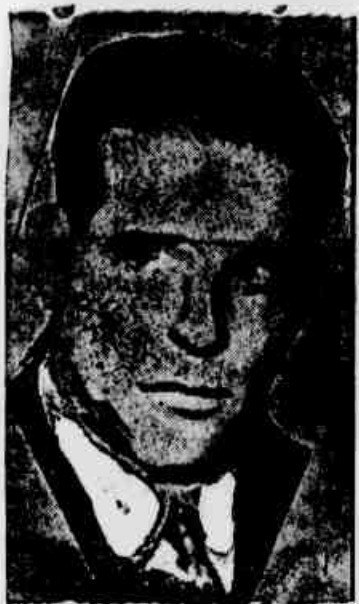
Sr. João Goulart

As declarações do Presidente nacional do PTB reveste-se da maior importância no momento presente. Elas contribuirão, sem dúvida, para reforçar as coligações eleitorais formadas