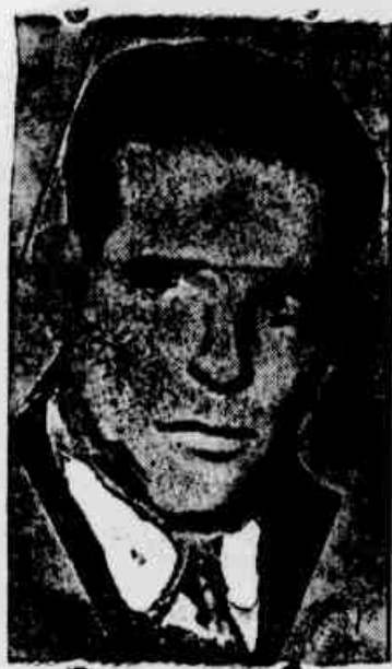
Sr. João Goulart

pelos trabalhistas e comunistas que ao lado de outras correntes partidárias em diversos