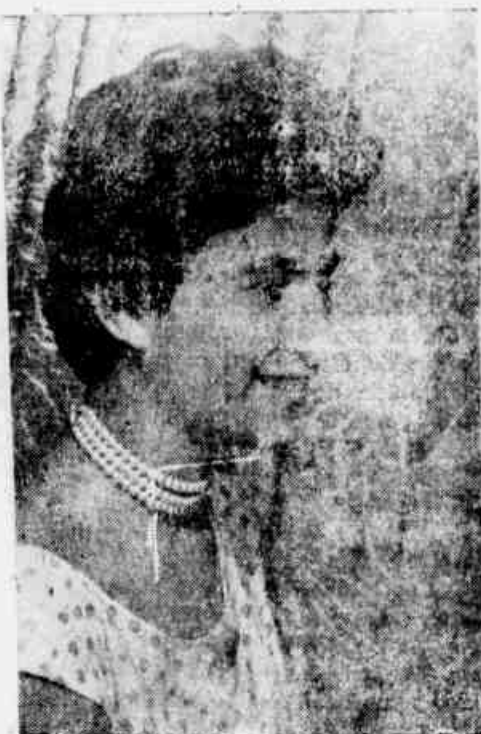
GERUZA — ORLA MARITIMA

Podemos informar aos nossos leitores que a grande festa de coroação da Rainha de "Folha Capixaba" será realizada na segunda quinzena de outubro próximo, devendo contar com a participação de destacadas personalidades de nossa vida política e social. Uma grande surpresa está reservada para esta festa. Aguardem e verão. Aproveitem os dias que faltam para intensificar a Campanha Pró Reaparelhamento de "Folha Capixaba", o jornal que pertence aos trabalhadores e ao povo.