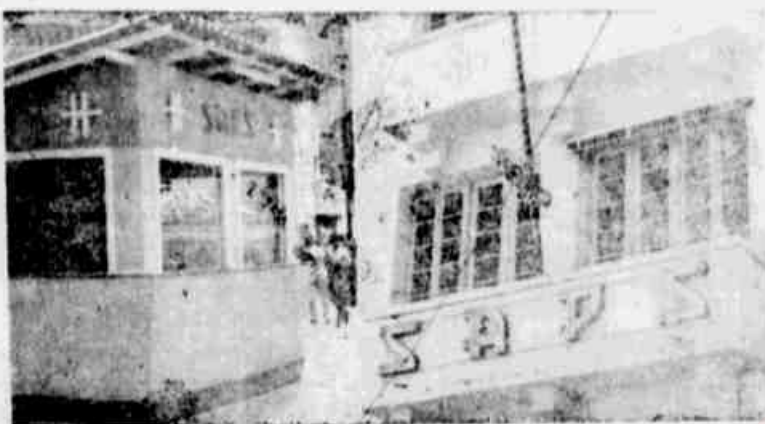
SAPS: ONDE AS BANDALHEIRAS TORNARAM-SE UMA CONSTANTE

Altos funcionários envolvidos na falcatrua — Instalada Comissão de Inquérito para apurar responsabilidades — Enquanto quase uma dezena de humildes servidores da autarquia foram atirados à rua, os principais acusados estão sendo inocentados