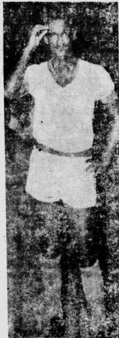
Bueno quer ser "peixeiro"

tebol um dia acaba. O craque, confortado por paredros atleticanos, mostra-se conformado e disposto a aguardar a convocação da C.B.D., já que é um dos craques visados por Feola para participar dos primeiros treinos da Seleção Canarinho.