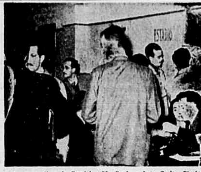
Os preparativos do Comício "São Paulo a Luiz Carlos Prestes" prosseguem sendo intensificados. O "clique" ao alto dá-nos um aspecto do trabalho de uma das sub-comissões empenhada no êxito da próxima assembléa do Pacembá

S. PAULO, 3 (Do correspondente) — Nos prosseguimentos à reunião iniciada ontem entre os elementos das organizações patrióticas e anti-fascistas e outras figuras de ativistas e políticos democráticos, ligados pelo trabalho e por solidariedade à realização da grandiosa manifestação cívica do próximo dia 15 de julho, divulgamos agora novas e expressivas declarações.