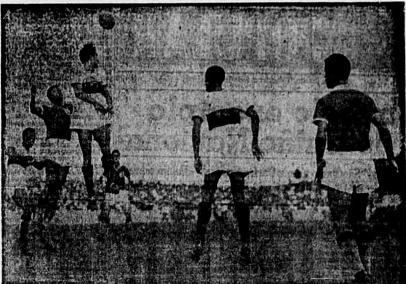
ATAQUE DO FLAMENGO — Pirillo levou a melhor na jogada, enquanto Avila, Zizinho, Viana e Tido, esperam o seu desfecho

No período final, desde os primeiros minutos, o rubro-negro procurou igualar a contagem. Foi a oportunidade para a exibição segura da retaguarda visitante. O sexto gaúcho anulou as investidas dos cariocas, aguentando a vantagem do escore até o 10.º minuto. O Flamengo precisou fazer duas alterações