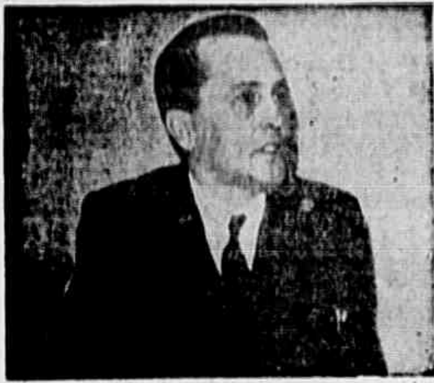
Luiz Carlos Prestes quando falava

Prestes falou aos professores - Governo de 1937 e 1940 Ontem, certos políticos burgueses eram, com o governo, agentes de fascitização, são hoje contra o governo, inimigos do povo - Impossível alfabetizar sem tirar o povo da miséria