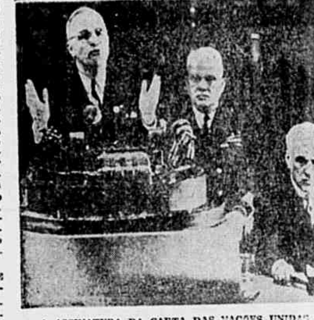
A ASSINATURA DA CARTA DAS NAÇÕES UNIDAS — Os três flagrantes acima apresentam diferentes aspectos desse ato histórico: no alto, o embaixador britânico, o presidente Truman observando a assinatura do documento; no meio, o presidente Truman observando a assinatura do documento; no meio, o presidente Truman observando a assinatura do documento; no meio, o presidente Truman observando a assinatura do documento.