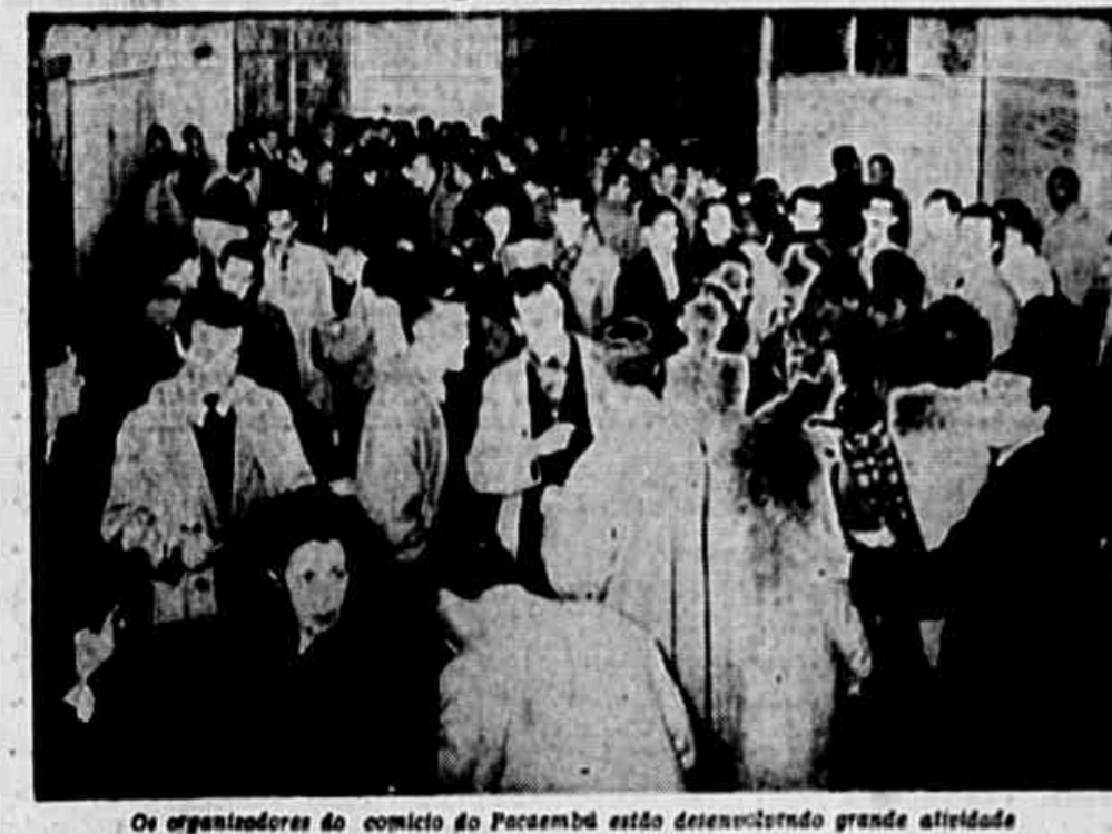
Os organizadores do comício do Pacembú estão desenvolvendo grande atividade

ANO I * Rio de Janeiro, Quarta-feira, 4 de Julho de 1945 * Nº 3