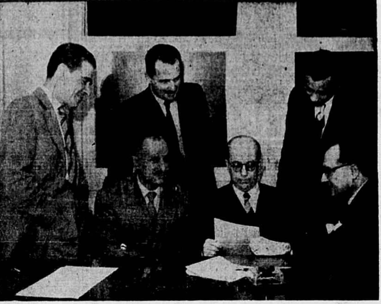
Astrojildo Pereira em nossa redação, quando lia, entre diretores da TRIBUNA POPULAR sua relevante declaração

Por motivo de força maior, foi adiado o debate sobre o discurso de Luiz Carlos Prestes, que estava anunciado para amanhã na UNE. Oportunamente será fixada a data em que se deverá realizar o referido debate.