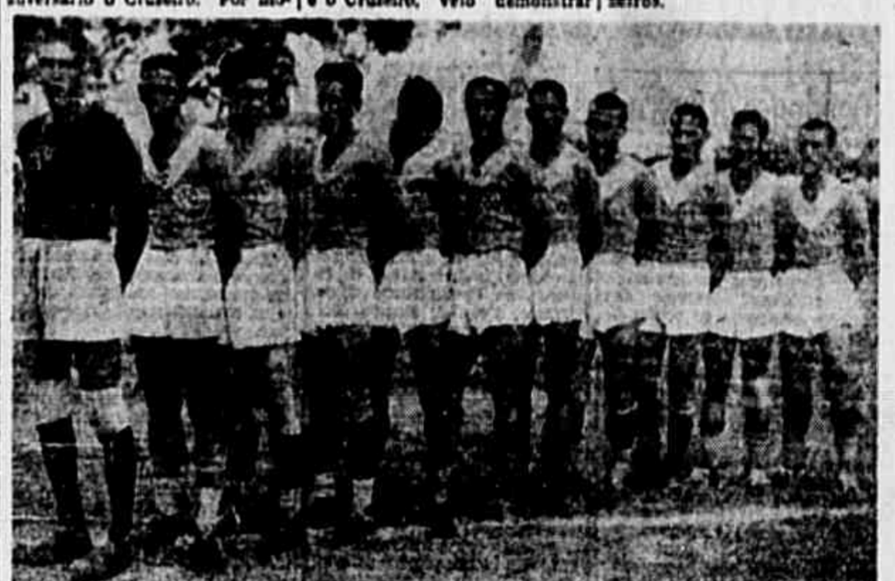
O time do Cruzeiro, bi-campeão mineiro

HOJE A SEGUNDA APRESENTAÇÃO DO BOTAFOGO EM BELO HORIZONTE As razões do adiamento - Será no campo do Atlético o jogo - BELO HORIZONTE, 3 (Assapress) - Não mais será esta noite, tal como estava programado, a segunda partida do Botafogo nesta capital, tendo o mesmo adversário o Cruzeiro. Por mo- AINDA O PRIMEIRO ENCONTRO BELO HORIZONTE, 3 (Assapress) - O interstadial de domingo último, entre o Botafogo e o Cruzeiro, veio demonstrar "Estádio Juscelino Kubitschek", ultrapassando, assim, de muito, o record anterior de rendas, que pertencia ao recente jogo Atlético x Corinthians, com 62 mil cruzeiros.