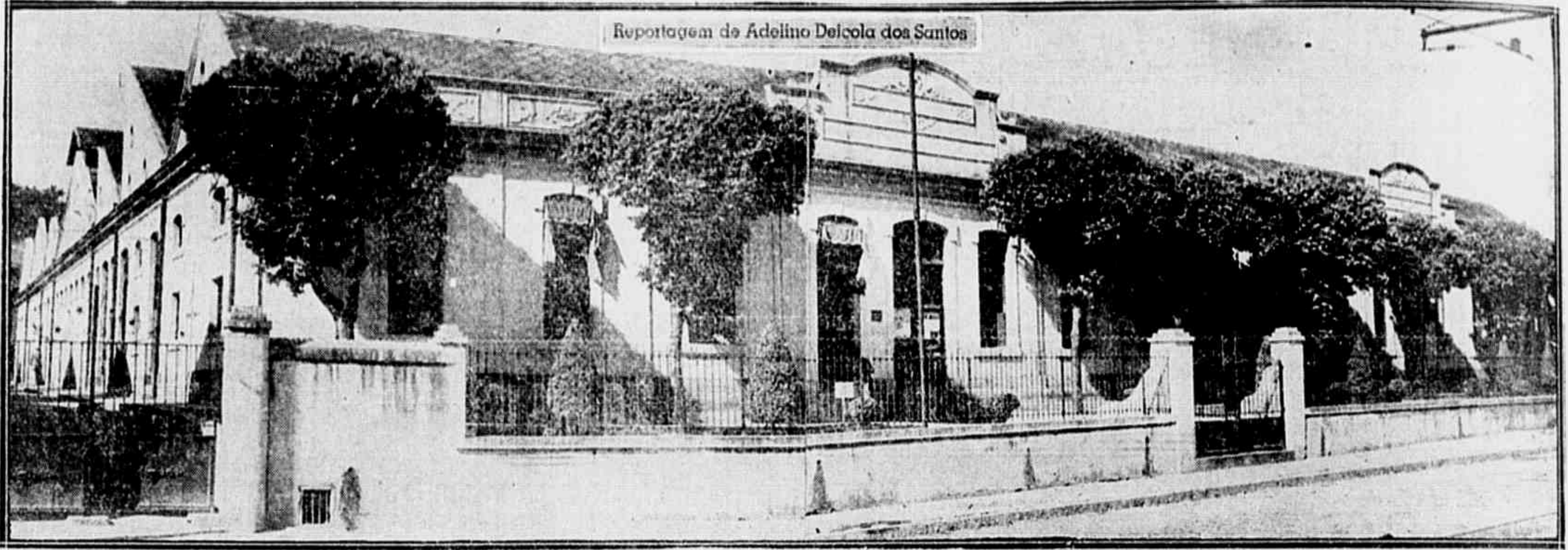
VISTA EXTERNA DA FABRICA DE CALÇADOS "GANDHI"

Centenas de operários aqui se agitam no interior da maior fábrica de calçados do Brasil. O trabalho, num grande ritmo, domina todos. Músculos e máquinas se confundem no esforço coletivo da produção social. Solas, couros e peles — matéria prima informe — passam, rapidamente, através das seções de corte, posponto, montagem, "good-year", acabamento, para chegarem, já sapatos e botinas dos mais variados estilos, ao baleão e à embalagem.