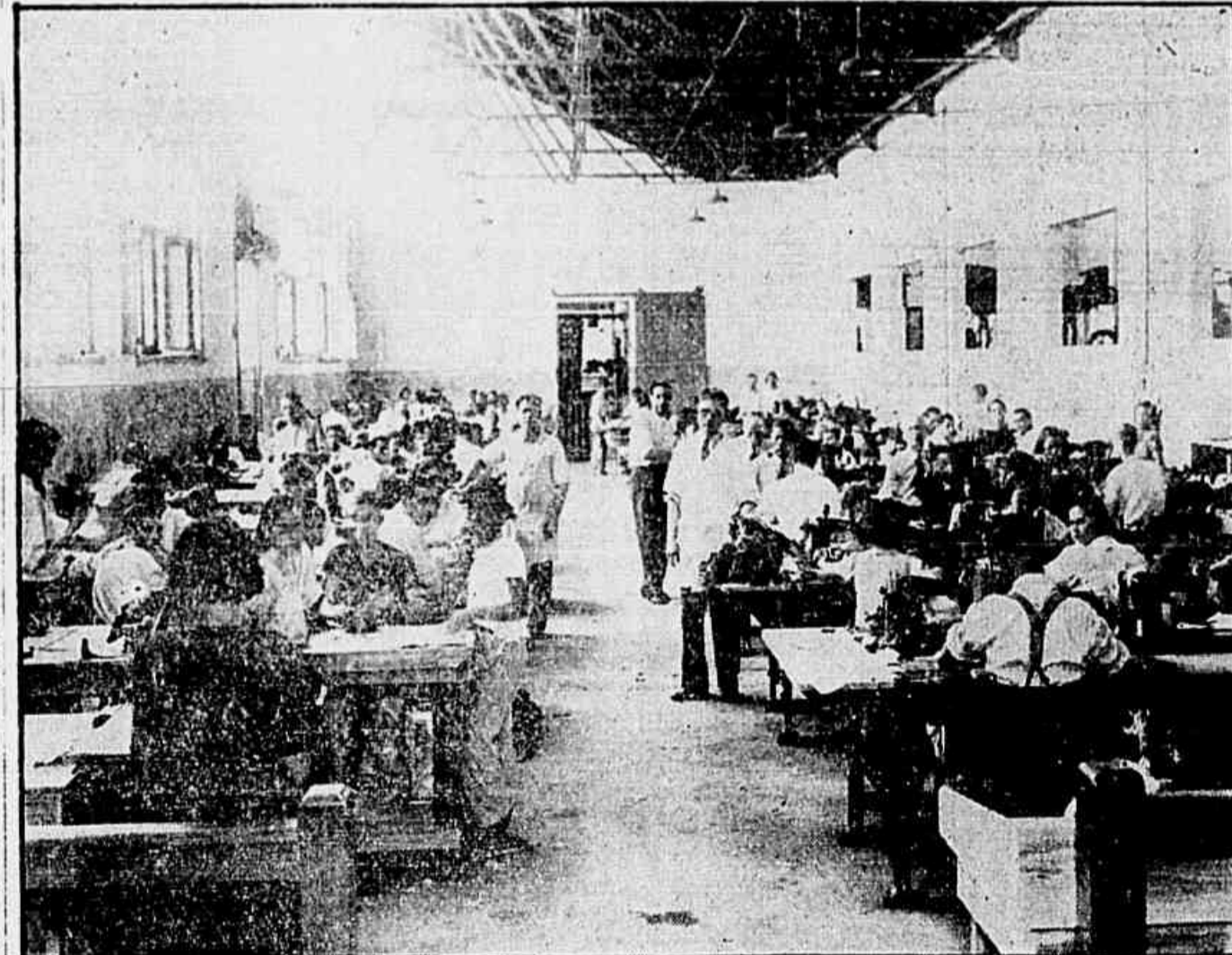
A SECÇÃO DO POSPONTO EM FUNCIONAMENTO

— "E' por isso que nós encaramos, como tarefa patriótica, o incremento da produção em nosso país. E' sobre a classe trabalhadora, sobre a massa camponesa, que pesa o velho regime, com toda a ignomínia do seu atraso. Queremos, por isto mesmo, marchar em passo acelerado para a industrialização. Duplicando a produção de nossas fábricas aumentaremos as forças produtivas do capitalismo nacional, dar-lhe-emos energias para derrubar os entraves que impedem o seu desenvolvimento e criar um amplo mercado interno com 30 milhões de brasileiros incorporados à vida econômica e política de nossa Pátria. Sentimo-nos orgulhosos, como trabalhadores concientes, de nossas relações amistosas com os diretores da fábrica Gandhi. Com eles, marcharemos, ombro a ombro, na campanha pelo aumento da produção".