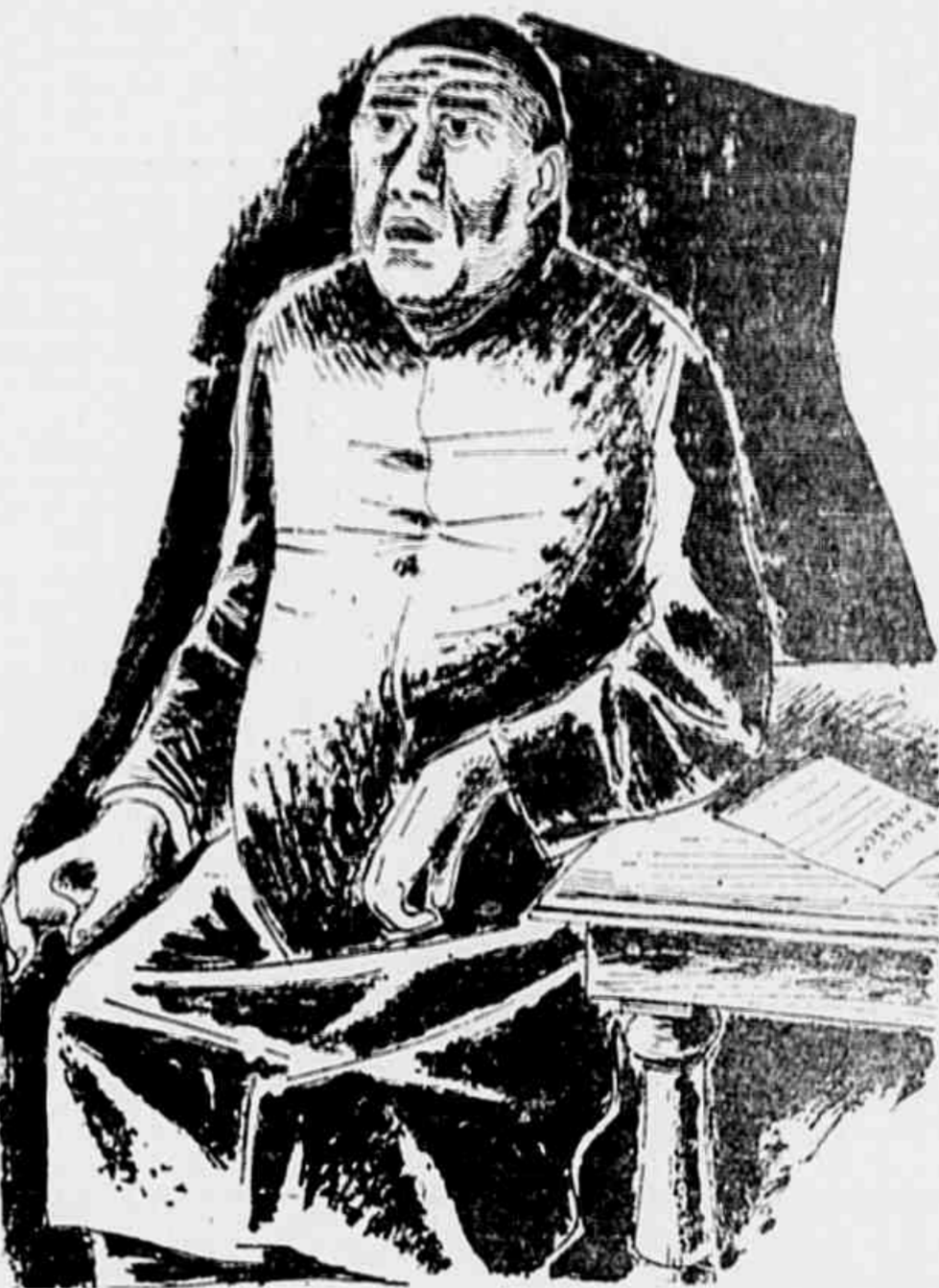
Ilustração de um homem sentado à mesa, refletindo sobre o texto.

uma outra abandonada. Naturalmente adotou a segunda aranha, e toda me pareceu mais acertada do que a primeira. A natureza criou a aranha para que ela fosse a aranha.