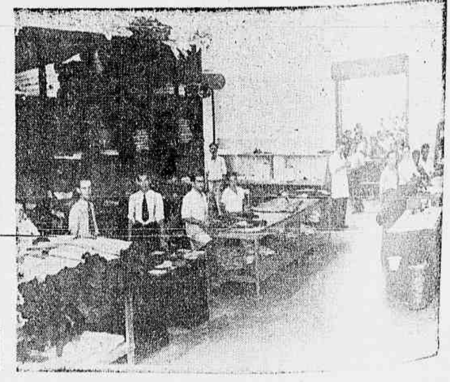
A ESQUERDA: O CORTE DE PELES. — AO CENTRO: OS CALÇADOS JÁ PRONTOS PARA A EXPEDIÇÃO. — A DIREITA: O ALMOXARIFADO