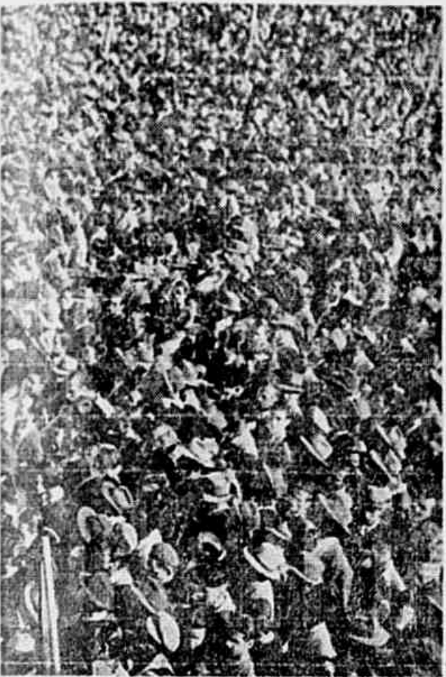
Multas compactas, como a que se vê no clichê ao alto, tomaram parte, cheias de entusiasmo e vibração patriótica, no grande comício do Parque Farrópilha, em Porto Alegre

Varias questões abordadas na reunião com delegados de municípios riograndenses — Os comunistas norte-americanos, a posição de Browder e o capital financeiro — É um erro considerar o capital financeiro em bloco como fascista — Berle decerto não expressou o pensamento do governo americano — O caso argentino e a maneira de encarar o governo Farrell-Perón