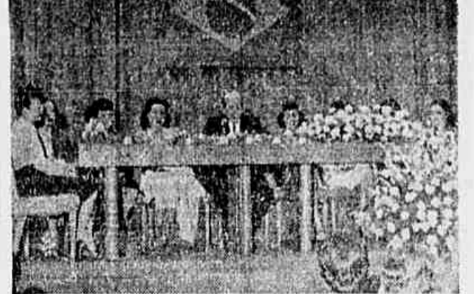
PERANTE NUMEROSA ASSISTENCIA o escritor Astorjildo Pereira realizou no auditório da ABI uma conferência sobre os principios do Marxismo-leninismo. Promoveu a reunião, em que o autor de "Interpretações" teve oportunidade de abordar a situação da América Latina, o comunista, a Célula "Barbara Heliodora". Na prateria fixa um aspecto da conferência

Por não se tratar de matéria eleitoral e, portanto, fora de sua alçada, o Tribunal Superior Eleitoral mandou arquivar a representação da União Democrática Nacional contra a medida adotada pelo D.N.I. com relação à criação de quota suplementar de papel para um matutino desta capital.