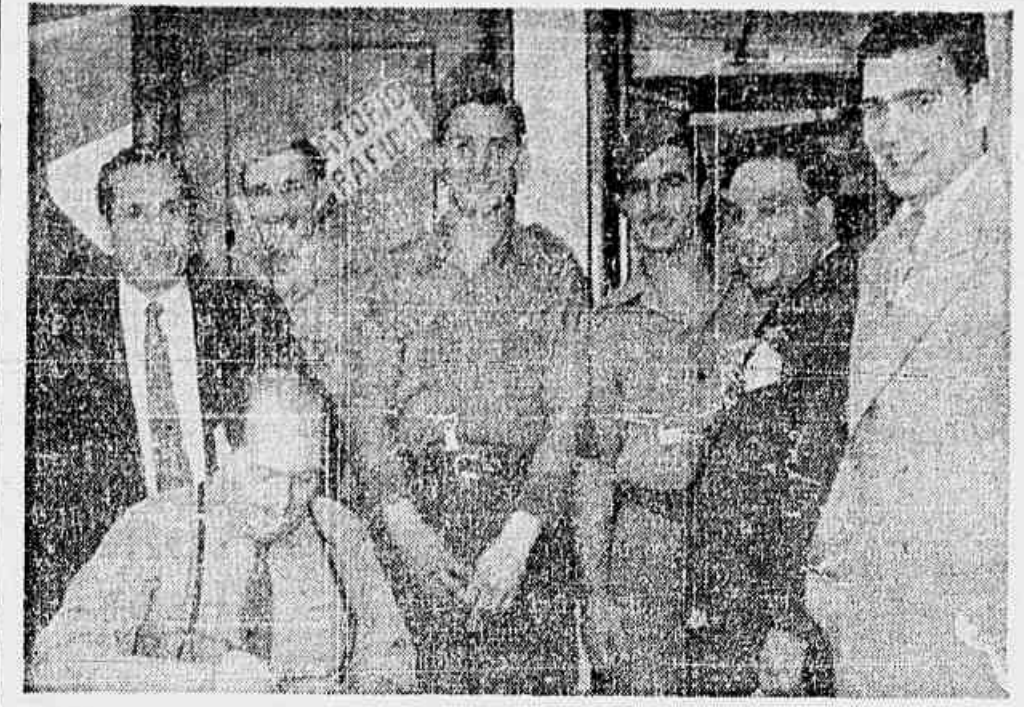
Mais de uma vez, feridos em combate, os três bravos guerrilheiros italianos que chegaram ao Rio, posam em nossa redação. Um deles exibe uma condecoração brasileira

A APROXIMAÇÃO cada vez maior que está havendo agora entre o presidente Grau San Martín, por um lado, e o Partido Socialista Popular e a Confederação de Trabalhadores de Cuba, por outro, tem provocado nos setores reacionários da política e da economia da pátria de Martí e Macero uma campanha alarmista que muito se parece com a de certos grupos que aqui giram em torno das duas candidaturas. O famoso "Diário de la Marina", por exemplo, está atacado de poro a poro, e como sempre, de insultos caluniosos contra os comunistas que ele se vale, Mas isso de nada tem servido, porque a medida que o alarmismo aumenta, aumenta o prestígio do chefe de Estado e das organizações do povo trabalhador que o apoiam, ajudando-o a marchar para a frente.