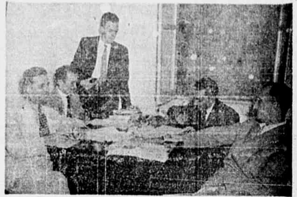
Membros da Comissão Executiva do PCB, quando falarem ao nosso redator, sobre o importante discurso do Presidente Vargas

OS PROBLEMAS DO POVO — Antes de serem formuladas perguntas pelos presentes, Prestes disse em rápidas palavras da sua satisfação em entrar em contato (CONCLUI NA 2.ª PAG.)