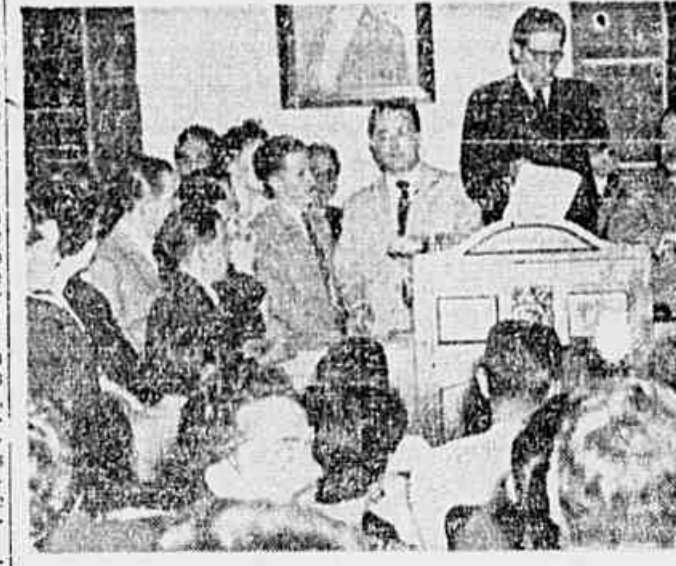
Um aspecto do comício de ontem, na Praça da Bandeira

O movimento geral dos homens soviéticos que procuram aplicar na indústria e na agricultura métodos técnicos ainda não empregados de racionalização e invenção, para que as massas possam ultrapassar as normas estabelecidas, continua se estendendo. Esse movimento é chamado "Stakhanovista", em homenagem ao seu iniciador, Alexi Stakhanov, mineira da bacia do Donetz. Um método "stakhanovista" de racionalização do trabalho permite extrair hoje, da bacia do sudeste de Moscou, 338 toneladas de carvão, em lugar das 100 ou 120 habituais.