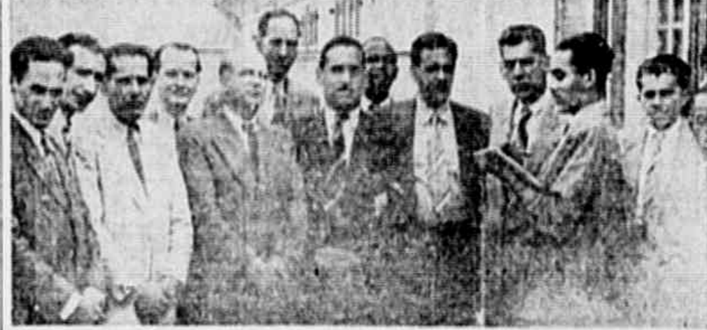
Delegação de marceneiros, apresentando declaração em nome redação, imediatamente após a audiência de conciliação do distrito coletivo da classe