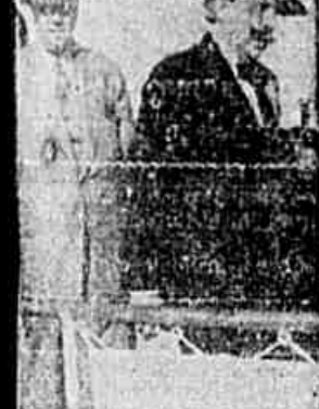
O general Eduardo Azaola

Pouca probabilidade da entrega ao Poder Judiciário — Distúrbios nas ruas de Buenos Aires