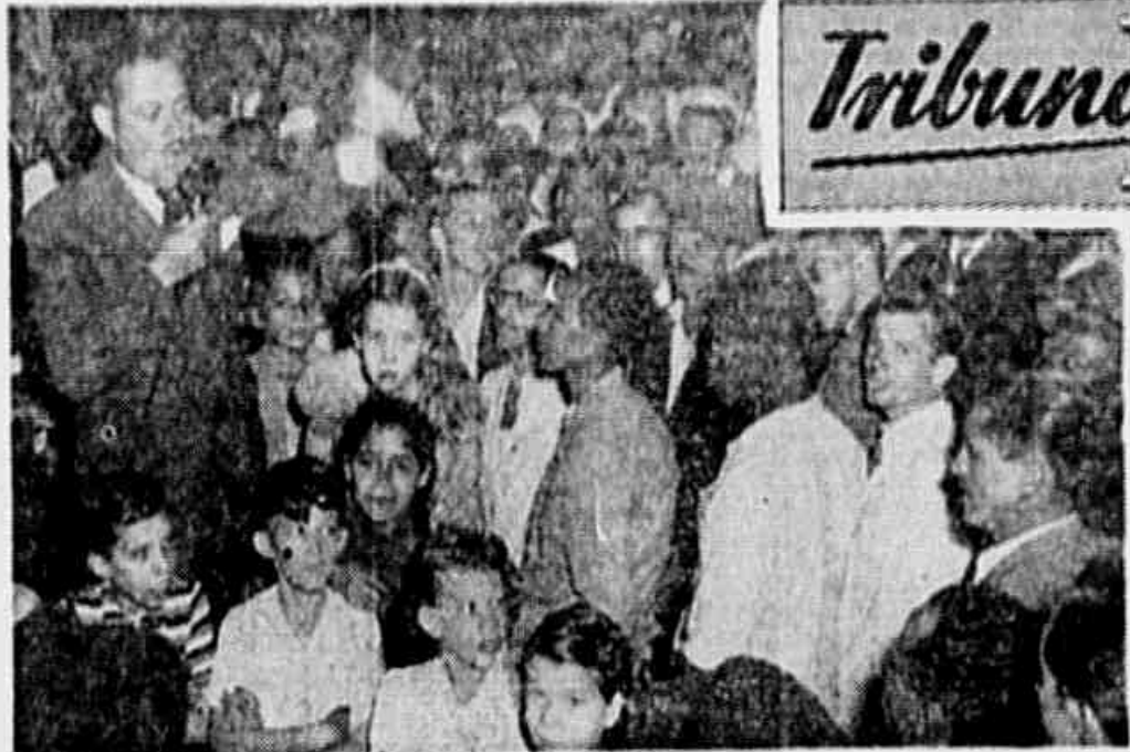
Um aspecto do Comício de ontem, na Praça da Bandeira

Foi, também, aprovada a redação de um Manifesto a ser submetido a assinatura das diretorias de Sindicatos que