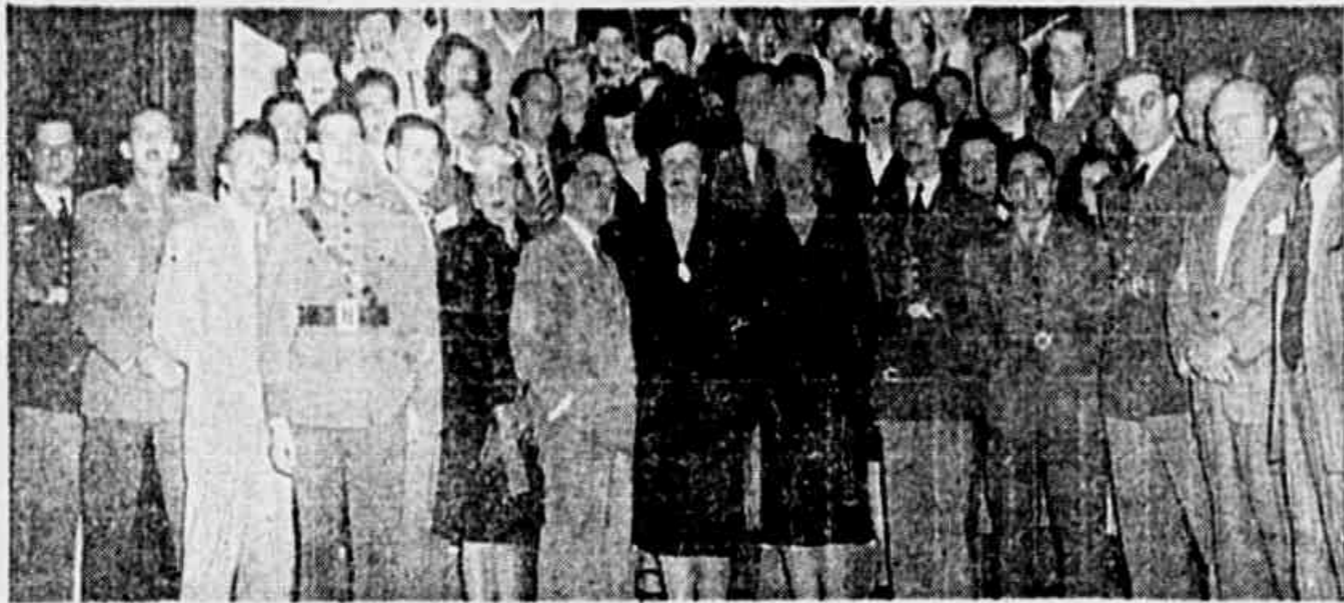
Pessoas que estiveram presentes á memorável reunião de ontem, na Liga da Defesa Nacional