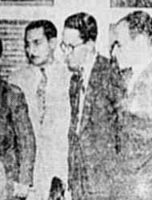
A PASSEATA DOS COMERCIARIOS — No clichê acima a passeata dos comerciantes do Rio de Janeiro, que esteve em nossa redação a fim de discutir a situação da classe...

Agora temos outra tarefa. Engrandece os nossos Sindicatos, sob cuja bandeira lutamos, e obtivemos esta grandiosa vitória.