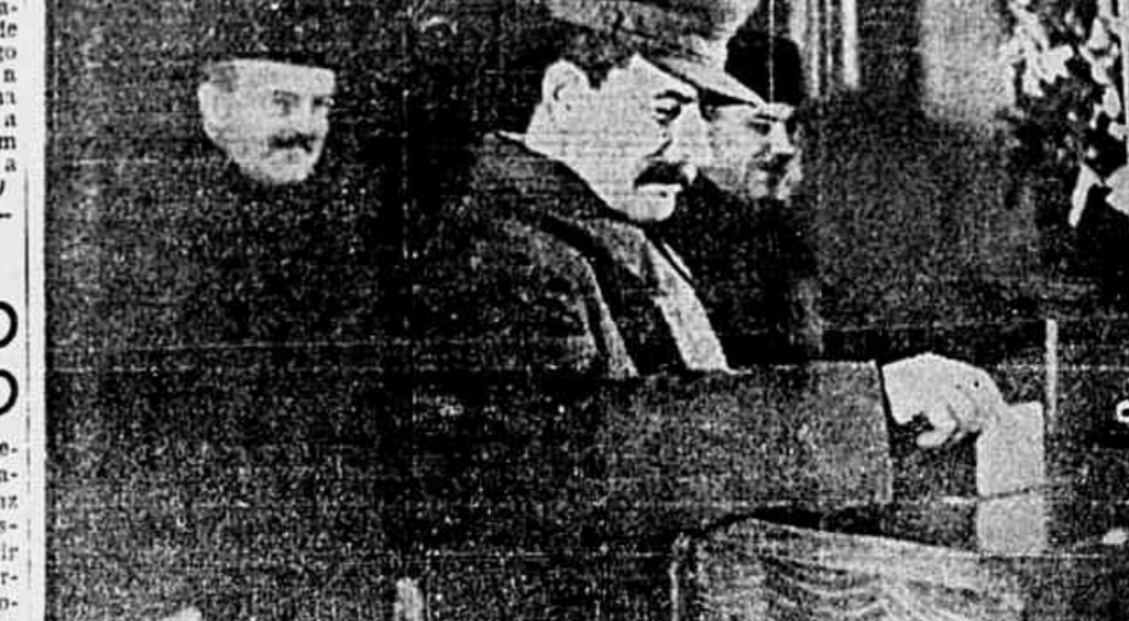
Stalin falando nas eleições para o Soviet Supremo da URSS, em 12 de dezembro de 1937. Molotov e Voroshilov, com as células na mão, aguardam sua vez.

Sufragio universal, direto, igual e secreto