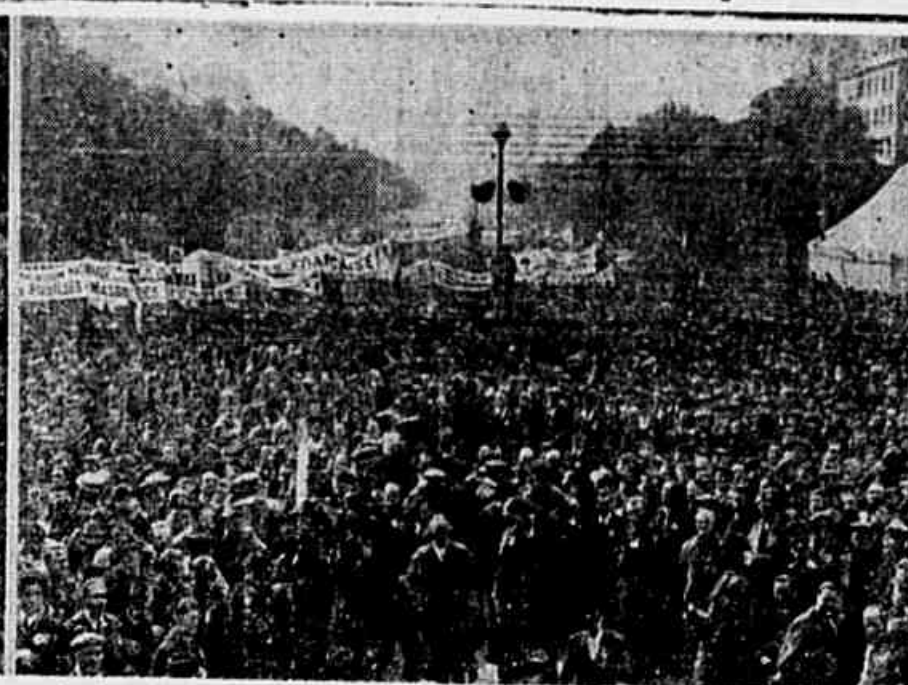
A esquerda, Maurice Thorez. A direita um desfile, durante o ultimo 1.º de Maio em Paris, tendo-se uma imponente massa popular na "Cours Vincennes"