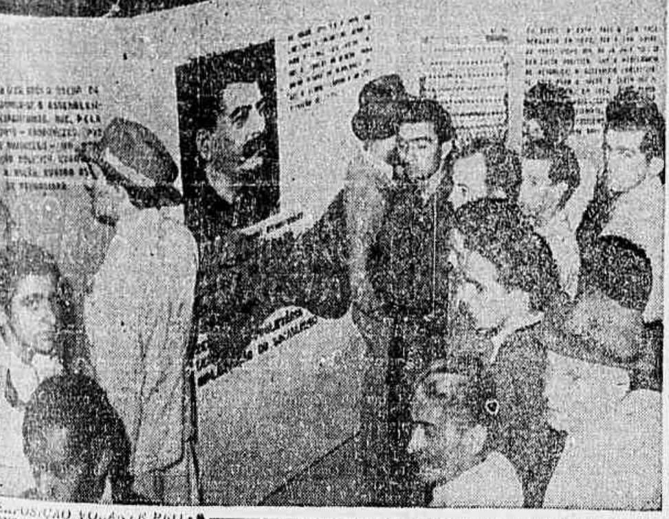
Enfrentando voluntária e pro-constituinte - Por iniciativa da Secretaria de Divulgação do Comitê Nacional do Partido Comunista do Brasil, está sendo realizada nesta cidade uma interessante exposição volante pró-Constituinte. Junto a um bloco, onde figuram frases, quadros e retratos, alistas á elaboração da Constituição da Inglaterra, do Estado Unidos da França, da União Soviética e do Brasil, faz-se um apelo ao povo para que participe da elaboração da Constituição, mais dentro de prazos imediatos do nosso povo, e misturas populares. O cidadão mostra-nos um aspecto da exposição e algumas das pessoas presentes á mesma.

LONDRES, 22 (U. P.) - A emissora de Moscou revelou que segundo informações de Teerã renunciou hoje o primeiro-ministro do Iran, sr. Sadr.