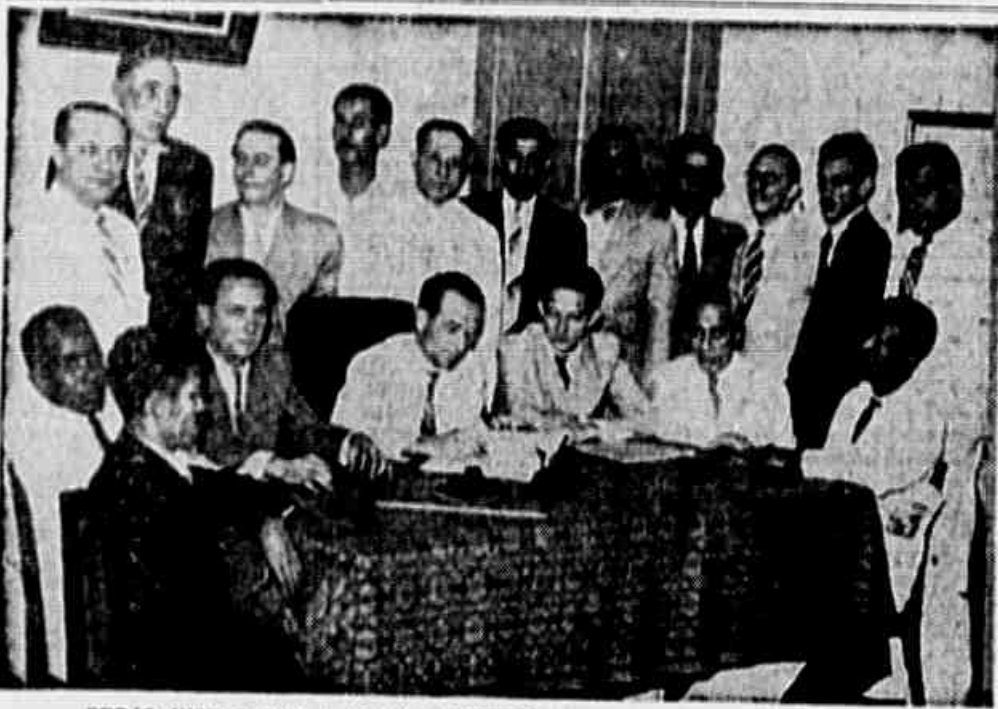
SERÃO INSTALADOS A 15 DE NOVEMBRO próximo, no Teatro João Caetano, em Vitória, o Congresso Sindical Fluminense. A fotografia acima apresenta os delegados sindicais que compõem a Comissão Organizadora da importante conferência, durante a reunião que ontem realizaram, e em que foi marcada a data definitiva da abertura do Congresso. Em nota "Tribuna Sindical" de hoje, reproduzimos as declarações que colhemos junto a vários líderes operários presentes a essa reunião preparatória.