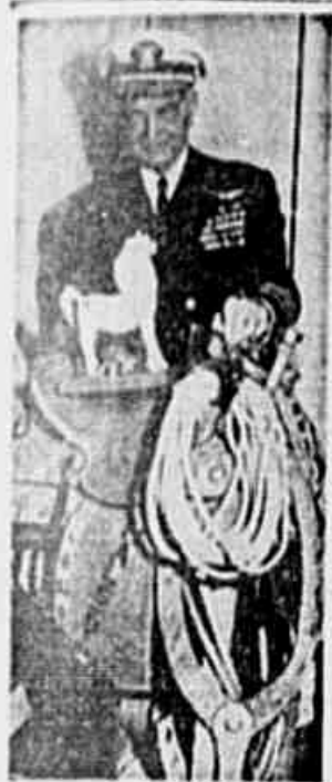
Luiz Carlos Prestes