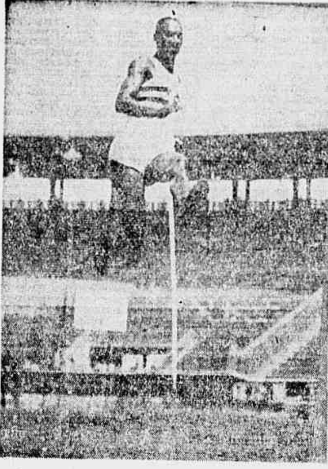
VASCO, TERRA CAMPEÃO DE ATLETISMO - A segunda parte do campeonato carioca de atletismo foi realizada na manhã de domingo último...