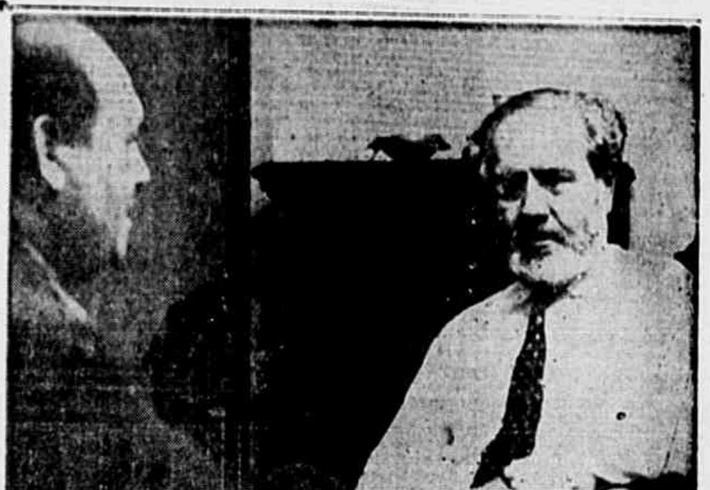
O momento brasileiro através da palavra do Barão de Itararé

hipótese de não ser convocada a Constituinte. Nesse caso, que fará o Partido Comunista? Ele sorri e diz: - Não somos tão pessimistas. No entanto, se dentro de um prazo útil, o governo não atender á vontade popular, nós, comunistas, teremos que tomar partido em face da campanha eleitoral, da qual não nos absteremos. Escolheremos então um candidato, uma pessoa capaz de executar um programa mínimo de união nacional, um homem que não seja propriamente um comunista, nem mesmo socialista, e esteja, portanto, em condições de inspirar confiança á burguesia, mas (CONCLUE NA 2.ª PAGINA)