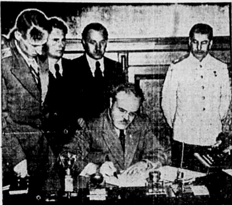
Molotov, que falou em nome do governo soviético nas comemorações do 28.º aniversário da revolução russa, aparece no clichê, ao alto, assinando um pacto de amizade, com a Polónia. No segundo plano está o generalíssimo Stalin, chefe do Estado Soviético.

Encerrada a Revista, e após ter recebido cumprimentos dos presentes, dirigiu-se o presidente da República, em lanchara especial, para o bordo do encouraçado Albatroz, para o encerramento do desfile.