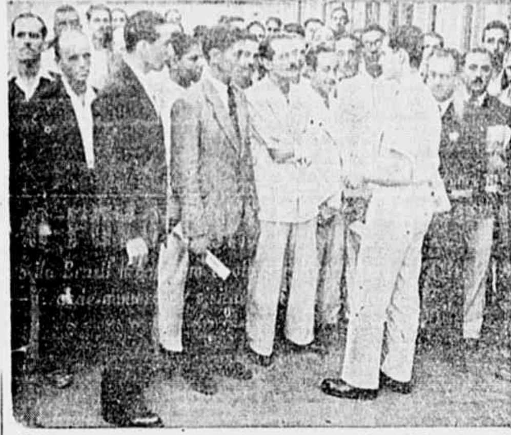
Trabalhadores da indústria de Niterói, com o seu líder máximo Luiz Carlos Prestes...