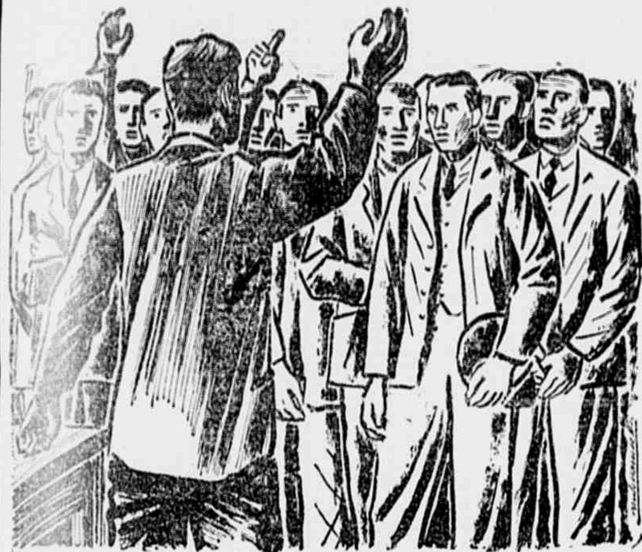
Um desenho de PAULO WERNECK

O proletariado e o povo do Brasil hipotecam apoio e solidariedade á "TRIBUNA POPULAR" — Grande número de visitas cartas e telegramas