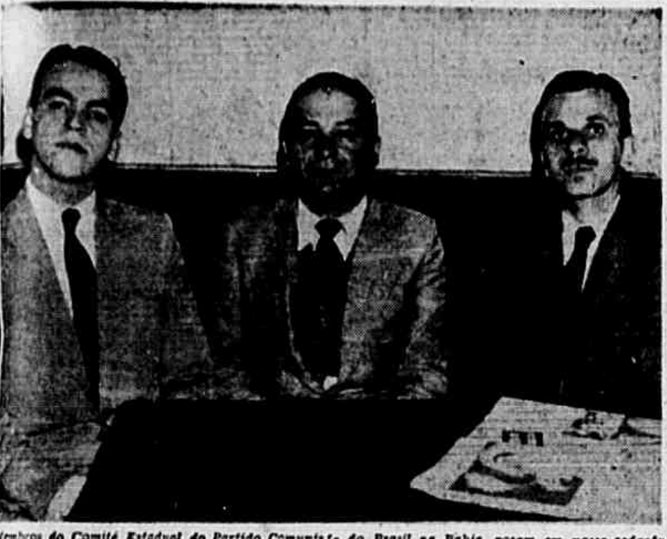
Membros do Comité Estadual do Partido Comunista do Brasil na Bahia, posam em nossa redação.