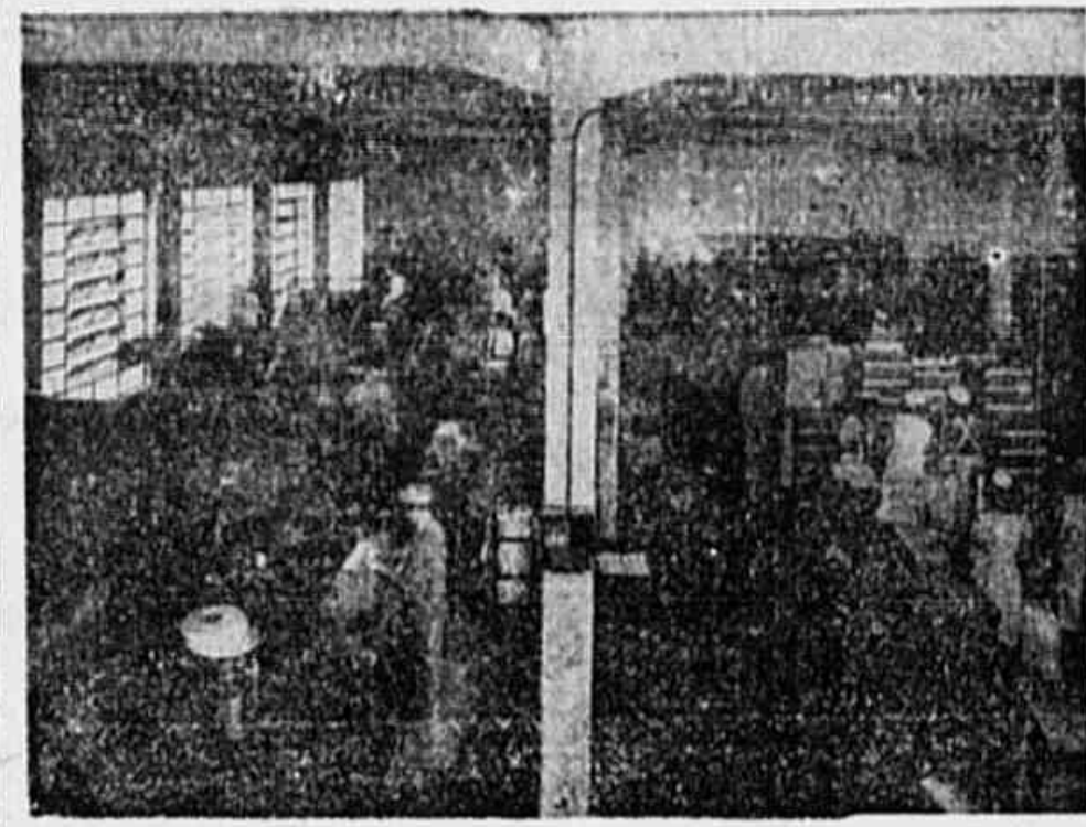
Vista parcial da fabricação de cigarros

Há que ressaltar, também, que, pela análise das contas até a presente data, se permitirá distribuir que o povo seja nela participante. Quisesse a Direção da FABRICA DE CIGARROS FLORIDA S. A.,