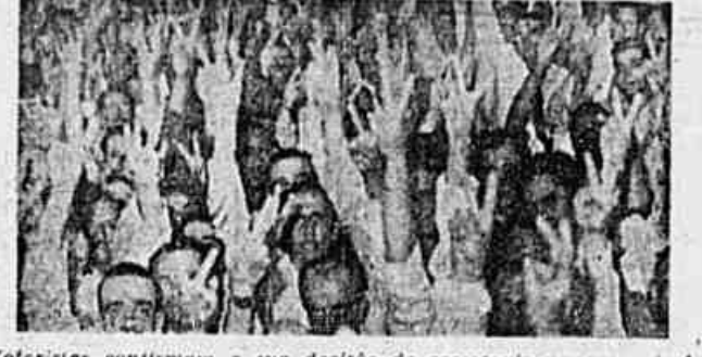
Motoristas confirmam a sua decisão de prosseguir na greve justa