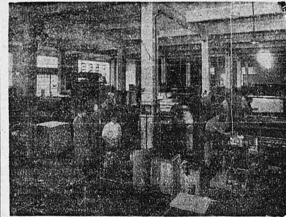
Parte da Secção de Litografia, onde são feitos os trabalhos de impressão das cartelas

Pelo exposto e se considerarmos que a "FLORIDA" não é uma empresa em organização, e sim, em função há 17 anos, pode-se admitir com absoluta matemática segurança que — subscrever as ações da