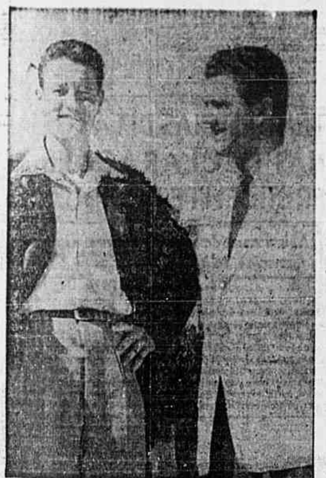
O nosso companheiro J. L. Pinto, enviado especial da TRIBUNA POPULAR, junto a delegação brasileira, quando colhia as impressões do "captain" boliviano.

Ainda a nossa campanha pela "Copa Rio Branco"