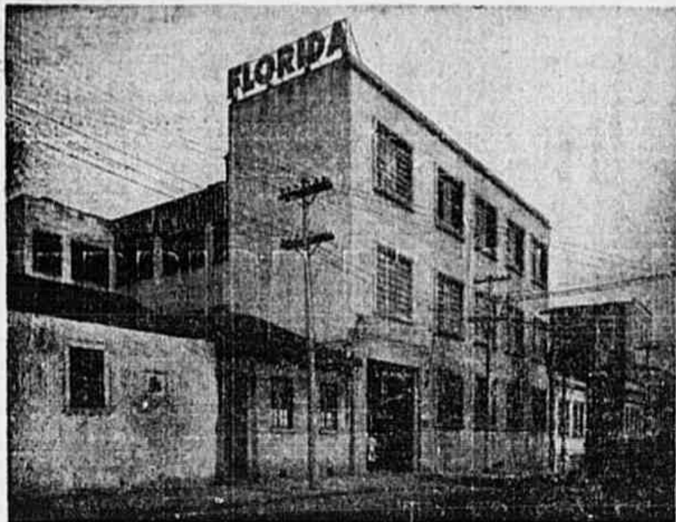
Vista parcial da fachada da FABRICA DE CIGARROS FLORIDA S. A., à rua Progresso n.º 173.

O aumento de capital social, ora oferecido à subscrição pública, lhe permitirá desenvolver, principalmente, as secções de fabricação de cigarros e de litografia, instalando-se nesta última a maquinaria da mais moderna precisão. Para se ter uma idéia da situação econômica em que se encontra a sociedade, basta que se diga que