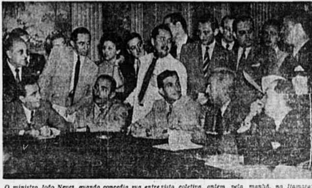
O ministro João Neves, quando concedia sua entrevista coletiva, ontem pela manhã, no Itamarati