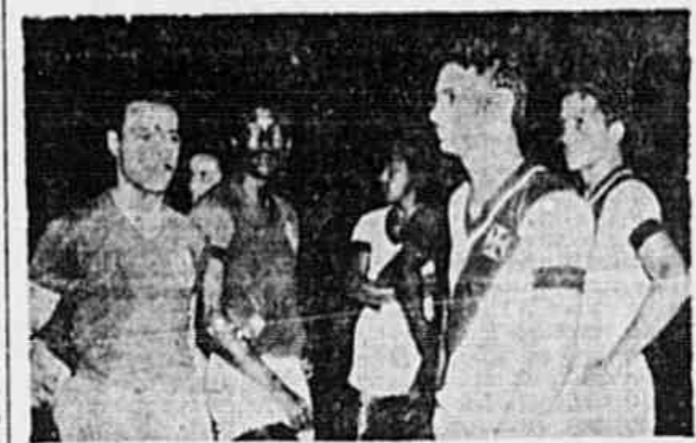
CAMPEÕES E VICE-CAMPEÕES DO TORNEIO - Rubros e vasco, que obtiveram as duas primeiras colocações no certame extra