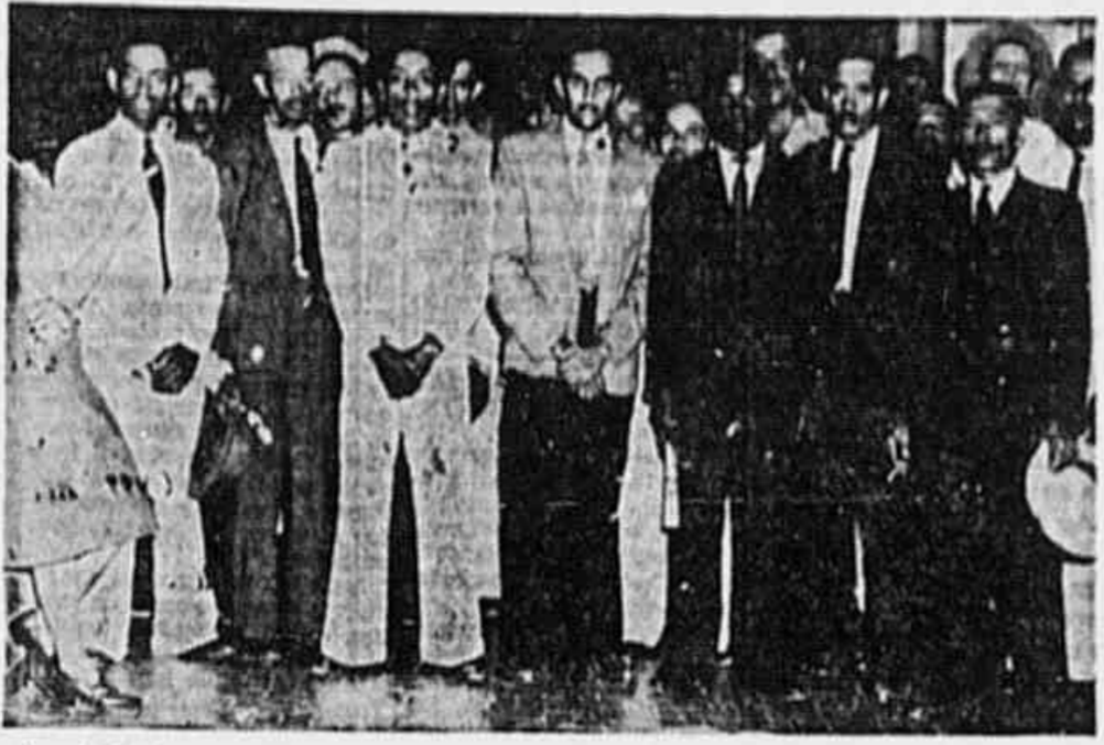
A comissão de operários da construção civil que nos deixou, para tornar pública a sua repulsa as violências da policia do banquete Negro de Lima

Os operários da construção civil pedem o afastamento de Pereira Lira e Negrão de Lima. A comissão de operários da construção civil que nos deixou, para tornar pública a sua repulsa as violências da policia do banquete Negro de Lima