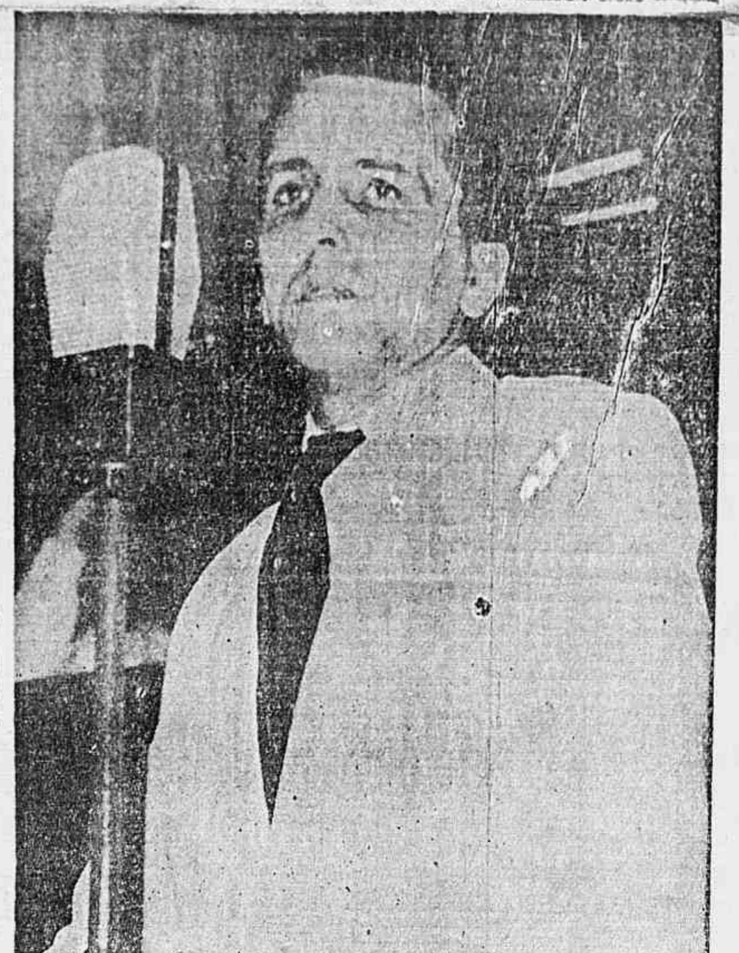
Luiz Carlos Prestes, ontem, na Constituinte.

que o fim de declarar que os tiros partiam das pedras circunvizinhas ao Largo da Carioca e do povo que estava nas imediações, tendo a Polícia feito intervenção para manter a ordem. (CONCLUI NA 6.ª PAG.)