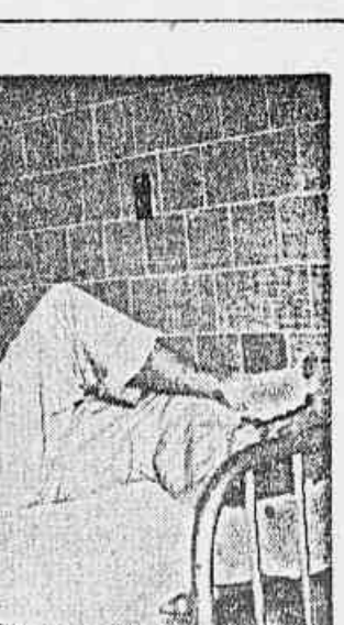
Três dos feridos, no H. P. S., cuja identificação não nos foi possível verificar ontem à noite, após a chacina nazista do L. da Carioca