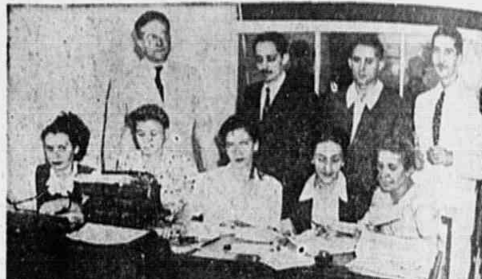
Elementos de direção da Associação Brasileira de Amigos do Povo Espanhol (ABAPE), que vai homenagear a Assembleia Constituinte pela sua repulsa ao criminoso de guerra Francisco Franco espanhol que o povo brasileiro reconheceu.