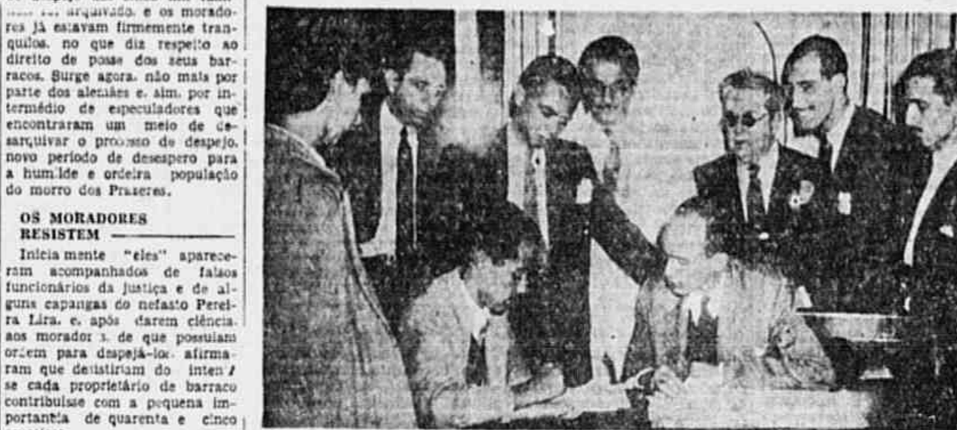
MARCHAM OS SECURITARIOS PARA A VITORIA - A movimentada assembleia realizada ontem pelo Sindicato dos Securitarios...