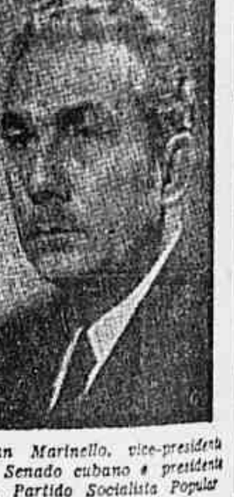
Juan Marinello, vice-presidente do Senado cubano e presidente do Partido Socialista Popular

de transportes, contra a violação de domicílios, contra as restrições de direitos, contra as metralhadoras viradas contra o povo. Traduziram a repulsa não só das mulheres como de todo o povo brasileiro, "contra todos os métodos fascistas que vêm sendo aplicados em nossa terra, porque temos consciência de que só assim não trairemos os nossos bravos soldados da P. E. B. na sua luta heroica pela liberdade e pela democracia".