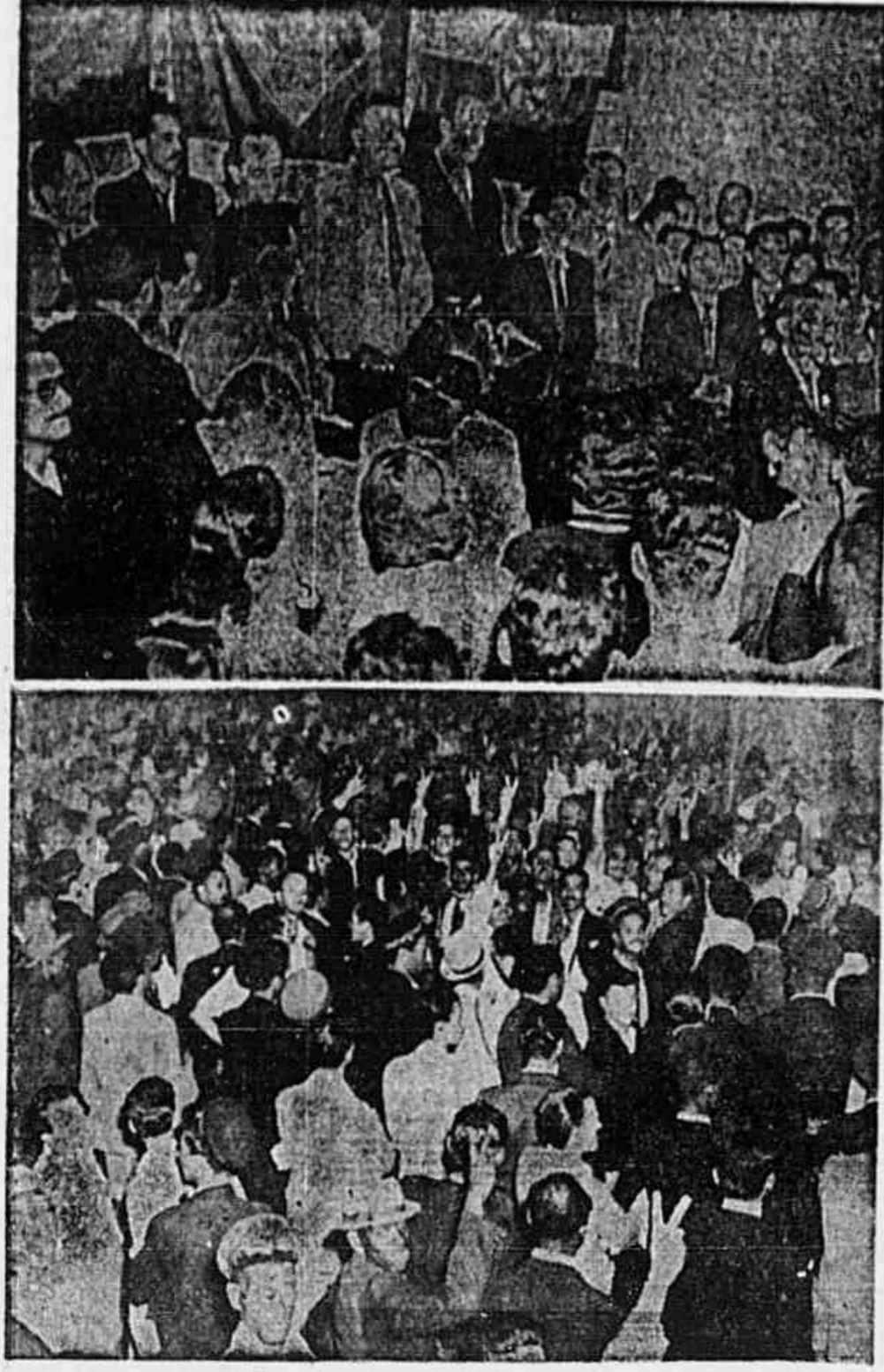
Dois flagrantes da assembleia de ontem dos trabalhadores da Light: ao alto, os parlamentares e dirigentes sindicais; em baixo, milhares de trabalhadores defronte da sede de seu orgão de classe, que se manifestaram entusiasticamente pela declaração de greve.