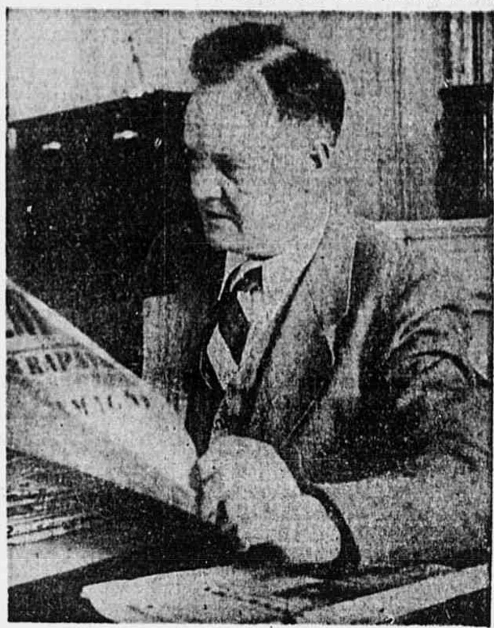
Maurice Thorez, vice-presidente do governo francês, que venceu uma batalha decisiva para a reconstrução da França e a vida da sua grande indústria: a batalha do carvão.

manamente possível de se esperar. E a batalha do carvão foi ganha por processos tipicamente stakhanovistas. Marcel Paul, o jovem ministro da Produção Industrial, encarregado da batalha da produção nas fábricas, tendo ao seu lado Charles Tillon, o líder dos metalúrgicos, hoje ministro dos Armamentos. E notável foi também a vitória no setor. A França rapidamente rumo de uma prosperidade com a qual no passado não podia sonhar, naquelas tristes tempos em que a sua economia estava em função unicamente de um pequeno grupo de exploradores e imperialistas das sinistras famílias.