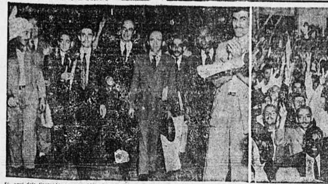
Est aqui dois fragmentos da assembléia de ontem dos trabalhadores da Light: à esquerda, a Comissão Parlamentar e a mesa do sindicato, seu apuro e gestos; à direita, os trabalhadores na sessão.