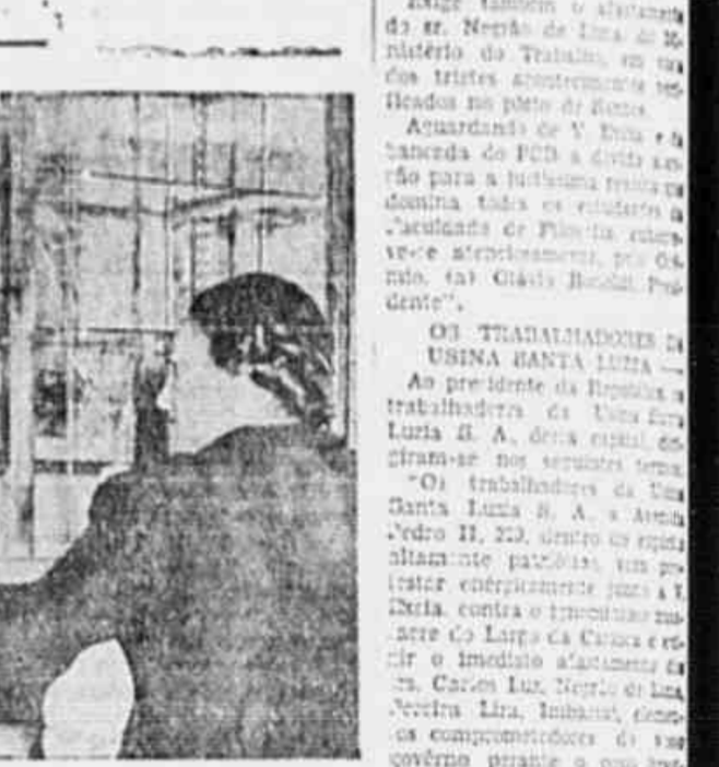
Nesta padaria o pão já reapareceu, apesar da tal “bilha” “Não há pão”. Esta é a prova concreta da manobra altista que se desmancha mais uma vez.

A manobra altista, dirigida pelo “trust” Bung & Born e por seus moínhos no Brasil, já está consumada — Populares, que padecem nas filas desde a madrugada, protestam indignados contra o novo plano dos esfomeadores estrangeiros e nacionais