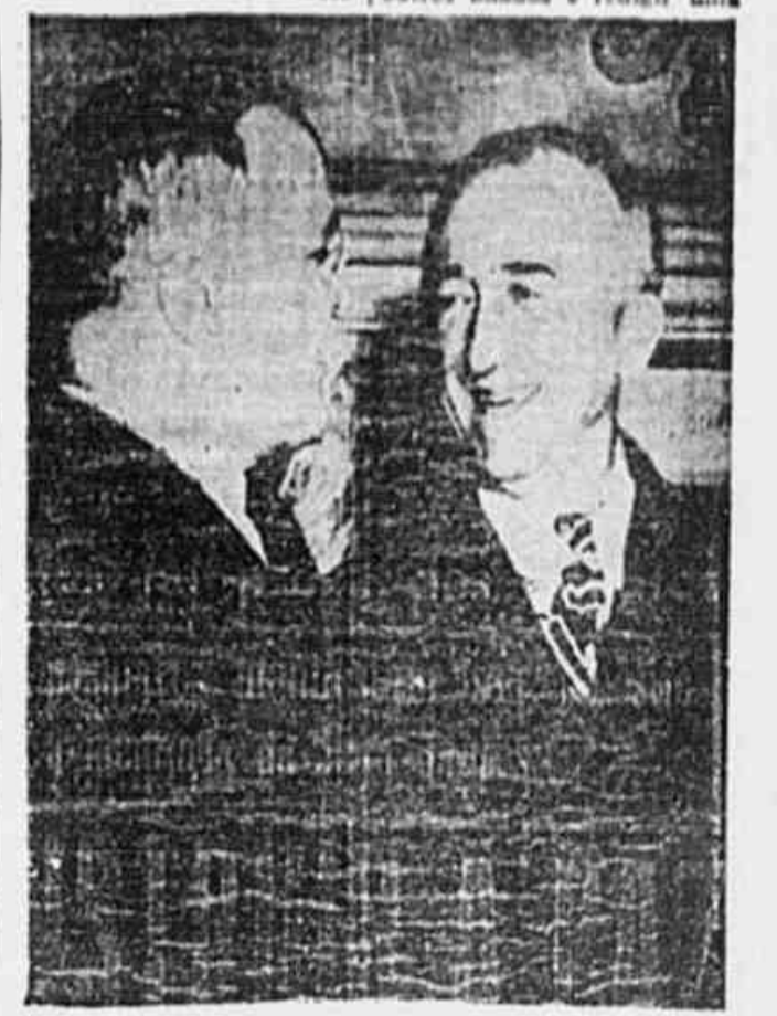
Byrnes e Molotov so de sua proposta para que todas as reuniões fossem francamente à imprensa. 2) Atlee declarou que os quatro grandes devem prestar ouvidos aos pontos de vista dos outros aliados e redigir uma

PARIS, 30 (De Lema J. Interlingua, da A. P.) — Foram os seguintes os acontecimentos de hoje na Conferência da Paz: 1) Byrnes arranjou aplausos dos delegados ao declarar que os Estados Unidos jamais voltarão à politica isolationista. Na primeira parte do dia, Byrnes obteve a aprovação pelo Comitê de Proce-