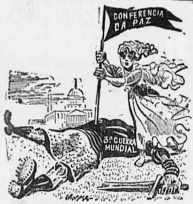
GROPPER, o grande caricaturista norte-americano, é o autor da esquisita "charge" ao alto, cuja oportunidade se agostou nestes dias em que se reúne a Conferencia de Paris. Uma figura, simbolizando a Paz, planta a sua bandeira exterior a sobre a a madura da III Guerra com que sonham os imperialistas.