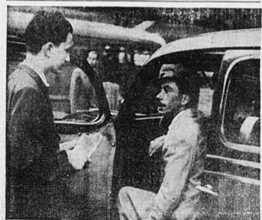
Um motorista quando falava á nossa reportagem

ANO II * N.º 368 * QUARTA-FEIRA, 31 DE JULHO DE 1946