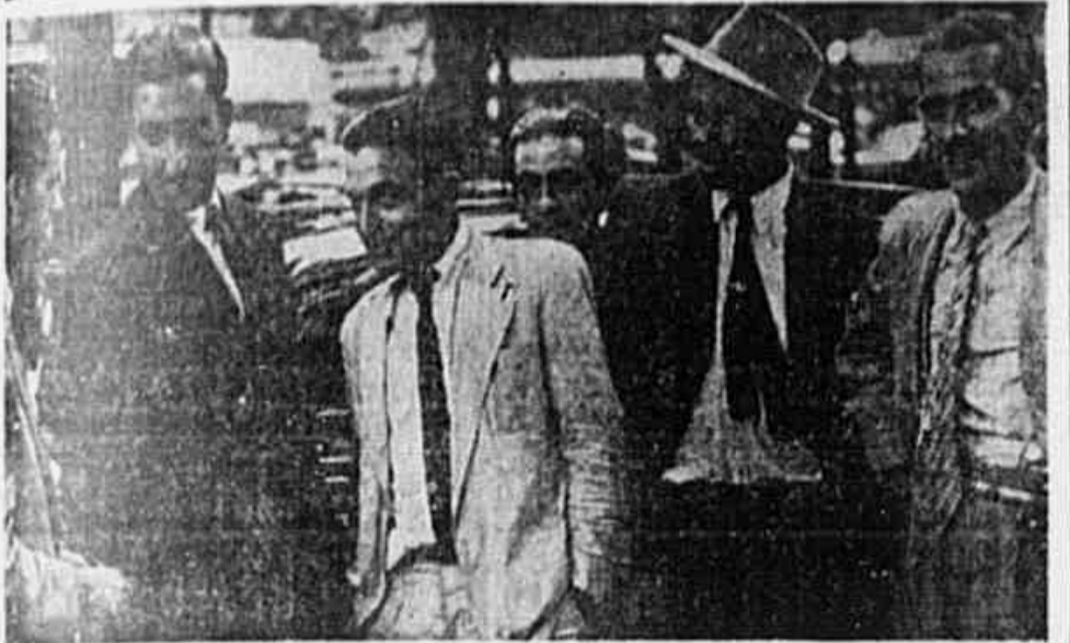
Diversos populares, quando falavam ao reporter

UNIDADE DEMOCRACIA PROGRESSO ANO 4 N.º 427 QUINTA-FEIRA, 24 DE OUTUBRO DE 1946