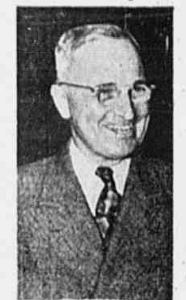
Sr. Truman guerra. Sabem o que ela representa em agonia e em futilidade. Não há nenhum governo responsável que possa ignorar ou fechar os ouvidos a esse sentimento universal. Os Estados Unidos não pretendem entrar em guerra, nem agora nem no futuro, com qualquer povo de todo o mundo. Toda a nossa política em relação a essas questões (CONCLUI NA 2.ª PAG.)

Prosegue em seu discurso o presidente dos Estados Unidos: «Recentemente, temos ouvido falar sobre as possibilidades de uma outra guerra mundial. Esses receios equivalem-se no mundo inteiro. Eles são sem fundamento e sem justificação. Entretanto, esses rumores de guerra ainda encontram em certos lugares ovinsos amigos. Se eles não forem contrariados, certamente não de dificultarão impedir o restabelecimento do mundo. Tenho lido relatórios e notícias de todas as partes do mundo. Todos eles são concordes em um ponto máximo: — os povos de todas as nações estão fartos de