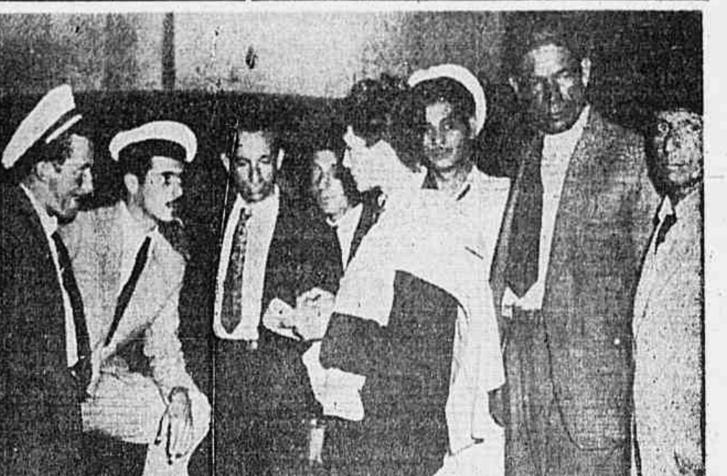
Motoristas de praça falando á nossa reportagem

Respondendo às críticas feitas contra a política britânica na Grécia, Atlee declarou: "Temos apenas um objetivo na Grécia: o de dar ao povo grego a oportunidade de decidir livremente (CONCLUI NA 2.ª PAG.)"