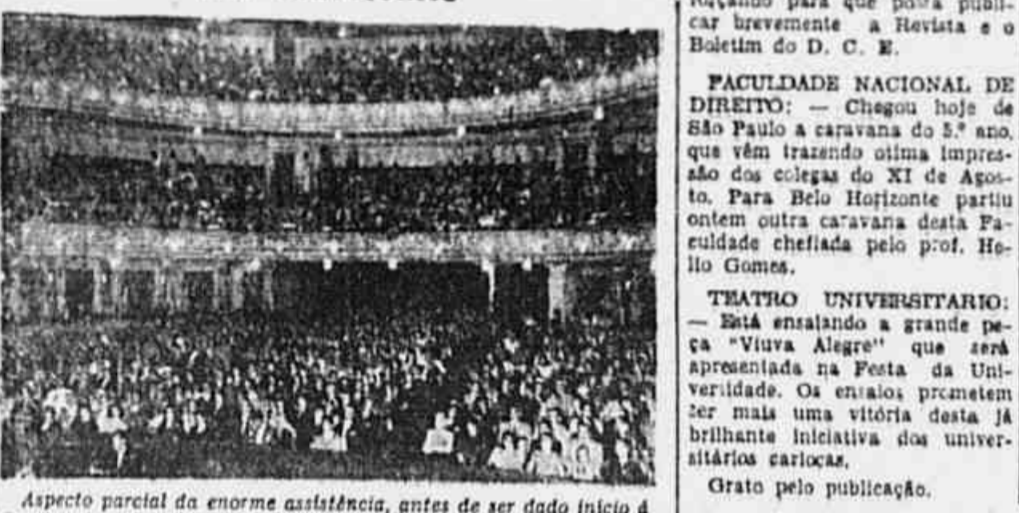
Aspecto parcial da enorme assistência, antes de ser dado início à Sessão Solene, no Teatro Municipal, Comemorativa do 20.º Aniversário