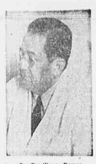
Sr. Graçiliano Ramos

No Comício da Liberdade, os trabalhadores e o povo aclamam os vinte e seis primeiros nomes da chapa popular, apresentada pelo PCB para as eleições de 19 de Janeiro.