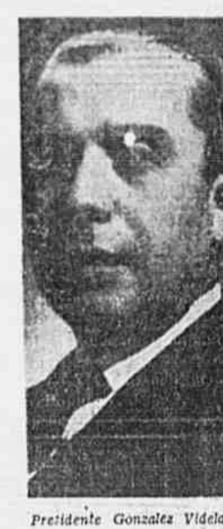
Presidente Gonzalez Videla

Nada pode a reação, como se vê, contra o povo organizado, porque é para a frente que a democracia está caminhando. E isso é uma prova a mais o exemplo chileno. Estão hoje no ostracismo os que ontem tentaram, num golpe fascista, fechar o Partido Comunista. E o Partido Comunista é hoje governo.