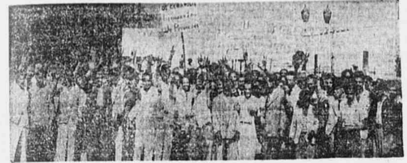
A grande massa de ceramícos presente ao primeiro julgamento do dissídio suscitado pela classe

gados, anônimos por estabelecer um acordo justo e razoável. Impossibilitado de estabelecer o acordo tão desejado pelos empregados, o presidente da Junta suspendeu a sessão, devendo continuar o processo em Instância Superior, onde em breve será procedido ao julgamento do dissídio.