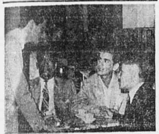
Perguntando a populares, o repórter coleta informações

S. PAULO, 31 (Do enviado especial da TRIBUNA POPULAR) — Estamos no Vale do Anhangabaú e dentro de poucos minutos terá início a demonstração número em que Prestes falará ao povo desta capital encerrando a campanha da Imprensa Popular. Diante do público onde nos encontramos, ao lado de organizadores do comício, estende-se, a perder de vista uma grande massa que espelha cartazes e dísticos. São os organismos de massa. São as ligas camponesas, que representam a