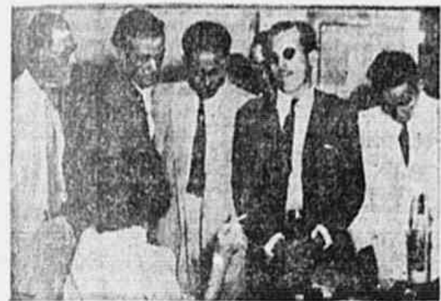
Carpinteiros navais, quando falavam á nossa reportagem acerca da grande assembléa sindical de hoje

Mesmo assim os carpinteiros navais preparando a grande assembléa de hoje, que a classe de fato, representativa de sua unidade e desejo de fortalecer a seu organismo sindical.