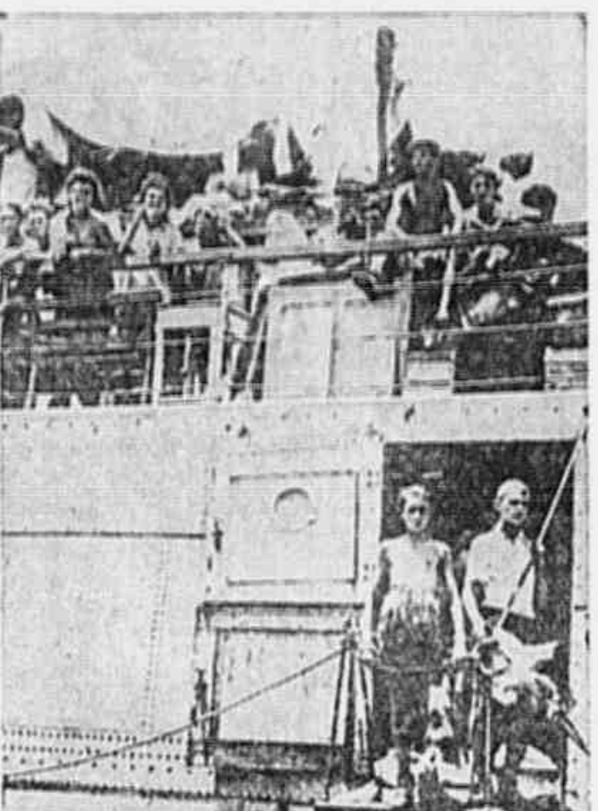
Uma cena do drama da Palmstina: emigrantes judeus jogados a água em um barco, porque estão proibidos de deixar a terra em que ali permaneceram.

O 29 de julho foi o dia em que as forças militares britânicas assaltaram o campo de refugiados de Palmstina no coração de milhares de pessoas o sentimento de um povo que, unido aos milhões de habitantes das colônias, extravasava de indignação.