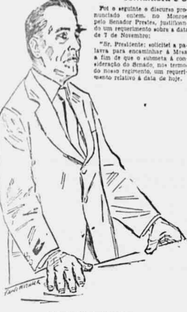
Senador Luiz Carlos Prestes

Um acontecimento de grande importância para a história da humanidade — A construção do socialismo e a política de paz dos povos soviéticos — Interessa ao nosso povo intensificar suas relações culturais com os nossos aliados da guerra contra o fascismo — Por que ainda temos intermediários em nosso intercâmbio de mercado com a URSS? — Um voto de congratulações proposto pelo representante comunista e outros senadores