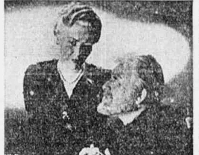
Akim Tamiroff e Gladys George, principais figurantes de "Seu único Pecado", que será encenado segunda-feira no São Carlos

Espetáculo de assuntos a tratar foi enviada a mesa, devendo-se breve ser convocada outra reunião para a prestação de contas da comissão de salários.