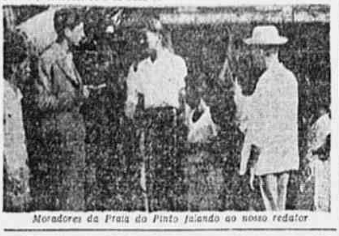
Moradores da Praia do Pinto falando ao nosso redator.

As casas estão caindo nos pedaços e o povo não recebe o auxílio para mitigar seus problemas. vivem abandonadas, sem educação escolar, pela falta de escolas. Existem somente duas: a do Parque Protetora e a do Comitê Desportivo da Praia do Pinto. Tanto uma como outra são pequenas, insuficientes para atender ao grande número de meninos em idade escolar e que vivem mal alimentados, trabalhando com a lama das valas.