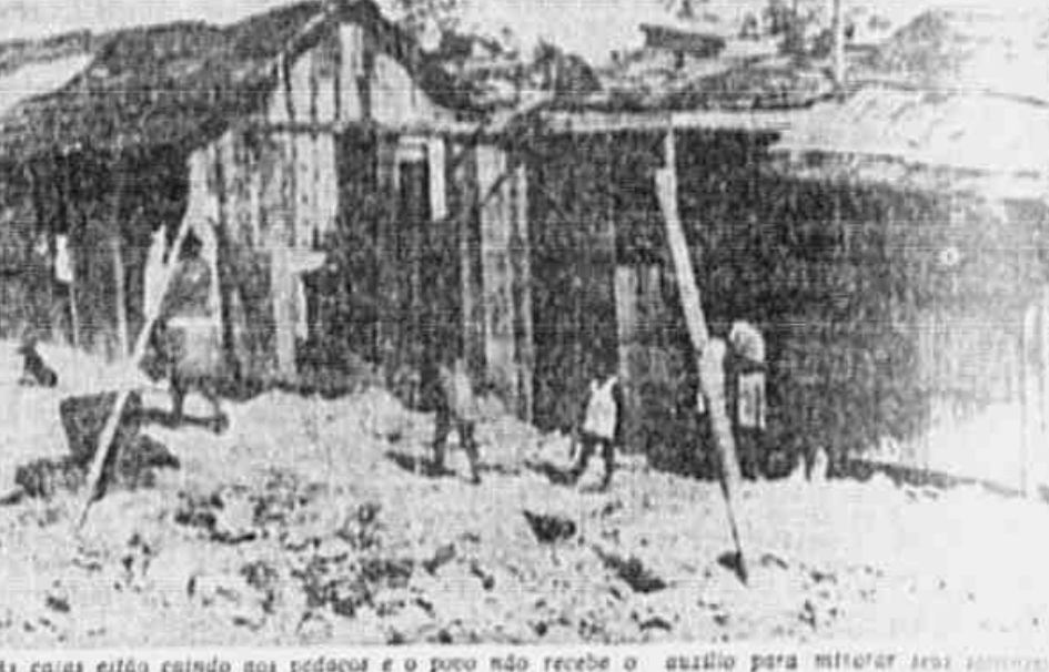
As casas estão caindo nos pedaços e o povo não recebe o auxílio para mitigar seus problemas.