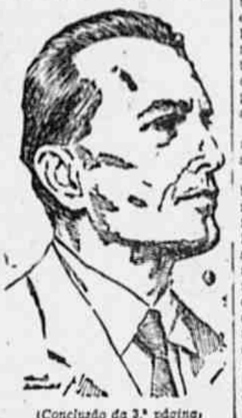
(Concluído da 3.ª página)

te, que somos surpreendidos com a mensagem ontem enviada pelo Poder Executivo à Câmara dos Deputados. E’ um documento de tal maneira contrário a tudo quanto estabelece a Carta Magna que se nos afigura mesmo constituir um erro, uma levianidade, dos auxiliares mais inmediatos do Presidente da República. Não cremos que o Ministro da Justiça, constitucionalista, que participou tão ativamente da elaboração da nova Carta Constitucional, pudesse concordar com mensagem desta natureza. (CONCLUI NA 2.ª PAG.)