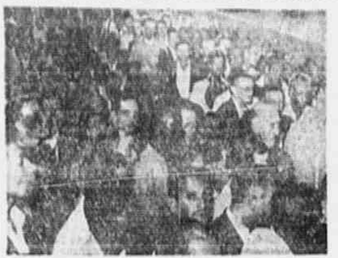
A clichê fixa um aspecto parcial da grande assembleia de ontem, na sede do Sindicato dos Trabalhadores na Energia Elétrica

Conforme fora amplamente anunciado, realizou-se na terça-feira última, na sede do Sindicato dos Metalúrgicos, uma grande reunião dos operários das oficinas mecânicas das empresas automobilísticas e de ônibus do Distrito Federal. Compareceram à assembleia mecânicos de numerosas empresas e oficinas, Estreia do Norte, Vitória, Relampago, Auto Mercantil, Santa Luzia, Stubbaker, Rodoviária e outras.